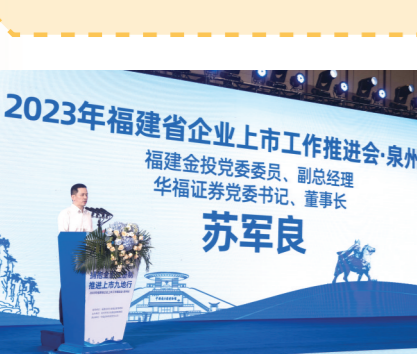
2023年8月8日,“2023年福建省企业上市工作推进会·泉州站”活动成功举行。今年华福证券在福建省内九设区市承办相关活动,以全面注册制实施为契机,助力推进闽企上市工作。

从1988年8月,福建省华福证券公司在福建开业;到1993年5月、8月,上海、福州台江和仓山的营业部开业并设立深圳业务部,开启省外布局;再到2020年4月华福国际(香港)金融控股有限公司在香港注册成立,正式开展境外布局,回顾走过的三十五载,华福证券从零到一,从一到全国,展现出金融助力高质量发展的系列成果。