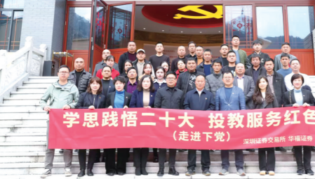
2023年2月13日,华福证券承办深交所“学思践悟二十大,投教服务红色行”投资者服务专项活动(福建站)走进下党村。华福证券国家级投教基地连续六年获评中国证监会“优秀”考核评级。

在风云激荡的时代中,华福人以“变”与“不变”勇立潮头。以“变”开局,立足八闽,布局全国,集团化经营和全国化布局不断深入。以“不变”开路,作为省属国有金融企业,将党建赋能置于强化“五个赋能”首位,始终坚持以高质量党建引领高质量发展。