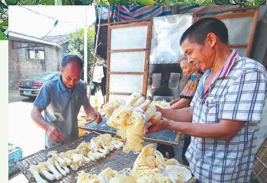
去年引种的300多亩竹荪,成为村民新的增收产业。