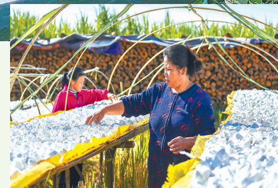
大湖村土地适宜种植地瓜,也衍生出地瓜粉、地瓜粉丝、地瓜干等农副产品。这是村民在晒地瓜粉。