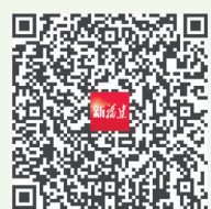
更多内容 扫码读图

眼下,小湖积极打造集茶产业发展、休闲观光旅游于一体的乡村振兴新引擎,通过举办喊山祭祀节、编撰《水仙茶·祖庭》画册、拍摄《水仙祖庭》微电影等形式,擦亮“水仙祖庭”品牌,做好茶、农、旅融合发展文章。