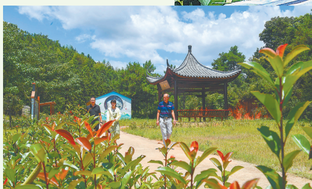
小湖镇借助水仙茶发源地的知名度,着手打造大湖村老枞水仙母树基地、双狮历水仙茶庄园等茶文化研学路线。