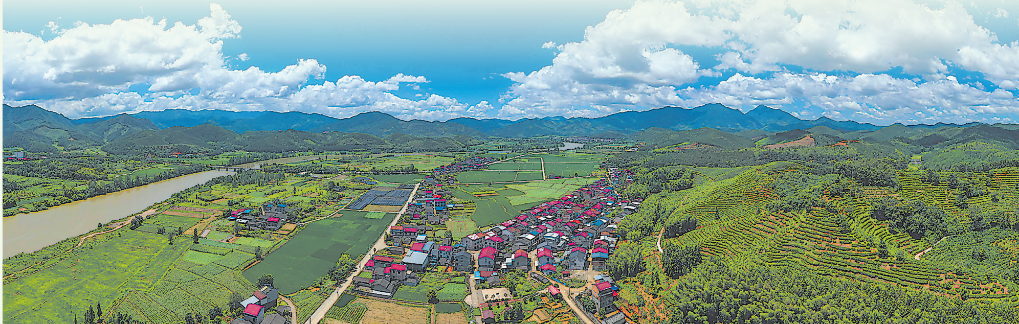
建阳区小湖镇大湖村依山傍水、气候宜人,是中国水仙茶的发源地。