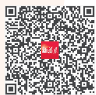
更多内容 扫码读图

辣椒产业初具规模,成了石牛村的“致富密码”。村容村貌焕然一新,建成辣椒培育示范园、辣椒记忆长廊,打造集特色种植、采摘体验于一体的农业观光百椒园……一个个项目的落地,让村民切实感受到了辣椒种植带来的美好前景。