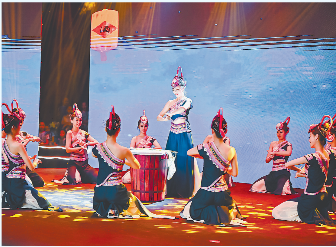
“乐·动海丝”青春嘉年华活动表演现场

赖清德“过境”审美闹剧冷场收场。虽然其精心装扮、卖力演出、大玩骗术，这出西洋镜还是碎了一地。世人更加认清其不折不扣的“台独”工作者、彻头彻尾的“麻烦制造者”真面目，更加警惕其假“和平”、真“台独”的欺骗性与不可测、不可控的危险性。 上世纪90年代进入政坛以来，赖清德始终高调宣扬“台独”，扮演“急先锋”，藉此谋得“深绿”势力青睐，被捧为“台独金孙”，在权位上得以平步青云。就是这个曾“忠心耿耿”表态无论出任任何职务不改“台独”主张的“政治工作者”，今年以来却“活风”突变：先是造出“和平保台”假词，欲盖“抗中保台”的真标，又投书外媒，抛出所谓“和平繁荣四大支柱”论。个中国由，明眼人都了然，就是此人如今有了更看重的“身份”——2024年台湾地区领导人选举民进党参选人。 “台独”意味着战争，而台湾民众渴望和平。盼着“上位”的赖清德心里清楚，“台独”是“票房毒药”。虽然不久前，他面对支持者忍不住狂言“走入白宫”是其“追求的政治目标”，但据报道美方不买账，要求民进党当局和赖清德澄清。如此“插曲”之后，在“过境”审美前，赖清德企图通过受访着力撕下“台独金孙”标签。 赖清德一番“操作猛如虎”，但一言以蔽之就是一个“骗”字。然而，灵魂深处那个“台独”工作者的本性难移。“过境”审美前，赖清德接受彭博社专访，报道则“恰好”在他行程中刊出。赖清德以参选人身份，通过外媒大搞“政治行销”。一篇专访稿，满纸荒唐言，宛若“台独白皮书”。 其一，谎话连篇，掩盖事实。赖妄称“事实是台湾已是主权独立国家”“两岸互不隶属”“中国想吞并台湾”，这毫无疑问是赤裸裸的“台独”言论。台湾问题的历史经纬清清楚楚，台湾是中国一部分的法理事实明白明白。两岸虽尚未统一，但中国的主权和领土完整从未分割也决不允许分割，台湾是中国领土的一部分的地位从未改变也决不允许改变，这才是国际社会公认的事实和法理，赖清德贩售的邪说根本站不住脚。 其二，恶人告状，颠倒是非。赖诬指“中国挑起两岸情势紧张”“中国意图改变以规则为基础的国际秩序”，还标榜自己的“责任就是维护台海现状”。这个“台独”政客自说瞎话就罢了，竟把世人都当瞎子。2016年以来，民进党当局公然贩卖“两国论”，企图破坏两岸同属一个中国的事实，还勾连外部势力谋“独”挑衅，这才是台海和平稳定的最大乱源，才是地区繁荣发展的现实威胁，这是任何粉饰狡辩都颠倒不了的。 其三，甘当棋子，卖台祸台。赖大肆渲染“中国威胁”，声称“台海问题是国际性问题”“国际红线即台湾红线”，企图将台湾问题这个中国内政“国际化”，兜售台湾作为外部势力遏华棋子的“价值”。乞求外人的“保护”和“支持”。这个“倚外谋独”、挟洋自重的旧戏码，进一步暴露了其为了谋取政治私利，媚外求荣、卖台祸台的险恶用心。 沉迷权欲的赖清德，处心积虑编造“台独”欺世谎言，不念台湾民众利益福祉，这样的政客可信吗？ “台独”与台海和平稳定水火不容，与台湾同胞切身利益背道而驰。当前两岸关系正面临和平与战争、繁荣与衰退两条道路、两种前景的重大抉择。相信台湾同胞能够擦亮眼睛，明辨祸福，把自己的前途命运掌握在自己手中。 (新华社北京8月19日电)