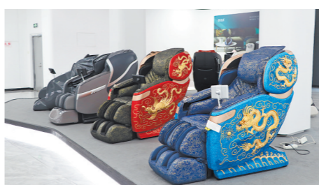
福建怡和电子有限公司展厅内展示的豪华按摩椅