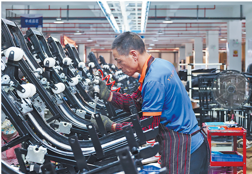
福建怡和电子有限公司智能生产线上,工人正在组装按摩椅。