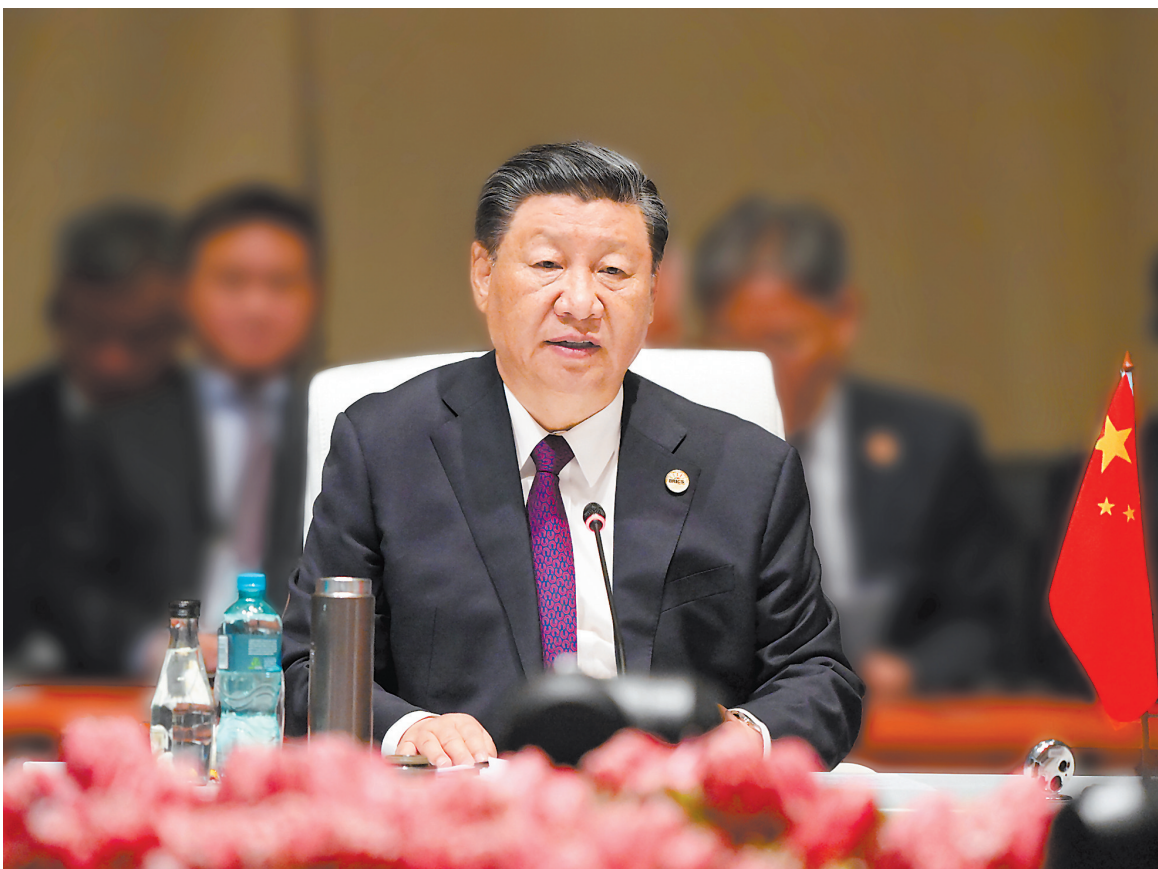
当地时间8月23日上午,金砖国家领导人第十五次会晤在约翰内斯堡杉藤会议中心举行。南非总统拉马福萨主持会晤。中国国家主席习近平、巴西总统卢拉、印度总理莫迪和俄罗斯总统普京(线上)出席。习近平发表题为《团结协作谋发展 勇于担当促和平》的重要讲话。