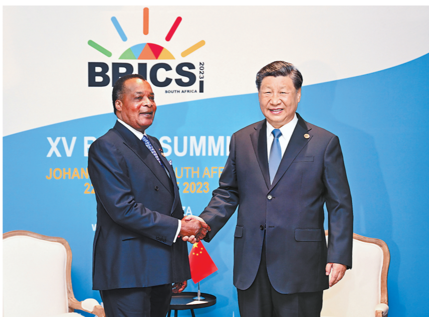
当地时间8月24日上午,国家主席习近平在约翰内斯堡出席金砖国家领导人会晤期间会见刚果(布)总统萨苏。