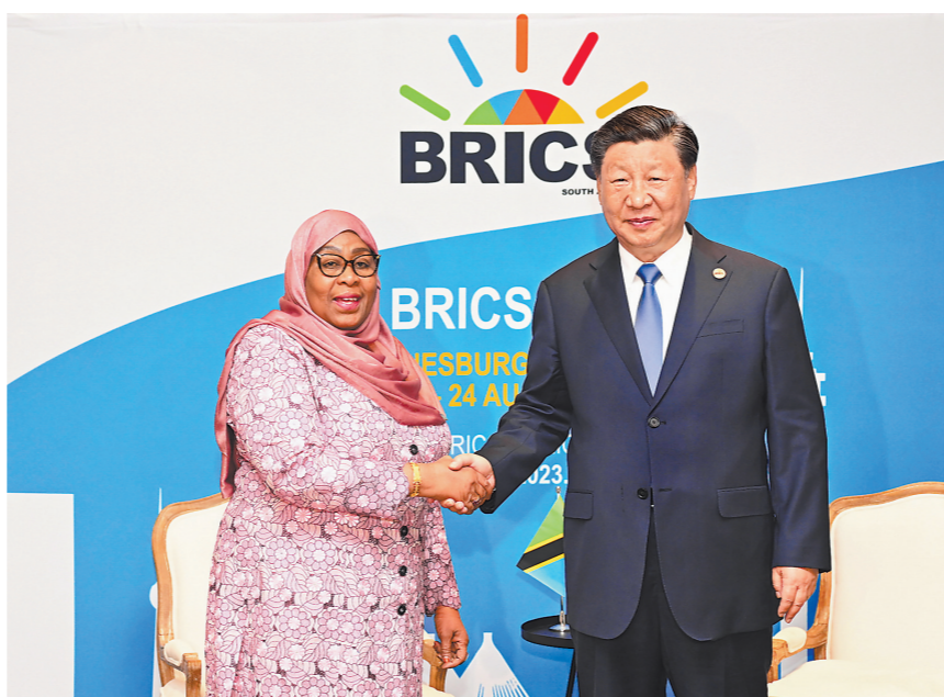
当地时间8月24日上午,国家主席习近平在约翰内斯堡出席金砖国家领导人会晤期间会见纳米比亚总统根哥布。

哈桑表示,我很高兴去年对华成功访问,并同习近平主席将两国关系提升为全面战略合作伙伴关系。坦中两国在各层级保持了密切交往,合作项目顺利推进。坦方高度评价中方为发展中国家发展提供宝贵支持和帮助,坦桑等发展中国家都从习近平主席提出的共建“一带一路”等重大倡议中获益良多。坦桑期待同中方共同庆祝明年建交60周年,进一步提升坦中关系发展水平。