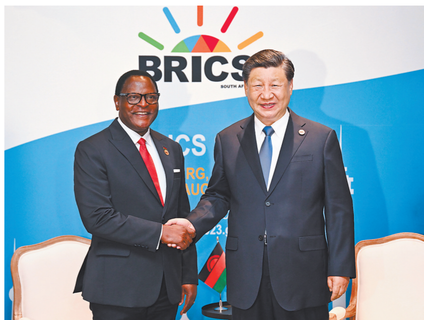
当地时间8月24日上午,国家主席习近平在约翰内斯堡出席金砖国家领导人会晤期间会见马拉维总统查克维拉。

(上接第一版)感谢刚方在涉及中方核心利益问题上给予中方坚定支持,中方也将一如既往地坚定支持刚方(布)维护国家独立自主、反对外来干涉,支持刚方(布)在国际和地区事务中发挥更大作用。明年将迎来中刚建交60周年。中方愿同刚方共同规划、隆重庆祝,保持密切交往,增强政治互信,深化务实合作,推动两国全面战略合作伙伴关系取得更多成果。