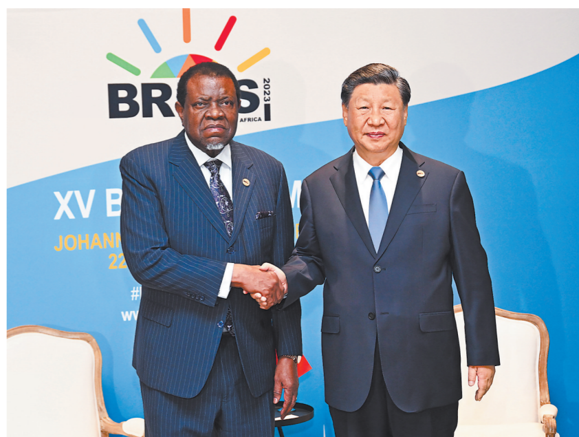
当地时间8月24日上午,国家主席习近平在约翰内斯堡出席金砖国家领导人会晤期间会见赞比亚总统奇夸瓦拉。

习近平指出,相同的历史遭遇和奋斗经历使中国和非洲心心相印。中国坚持大小国家一律平等、相互尊重。中国共产党领导中国人民走出了一条具有中国特色的社会