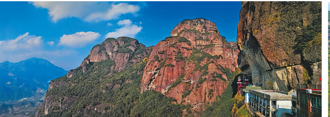
建于悬崖峭壁上的灵通寺