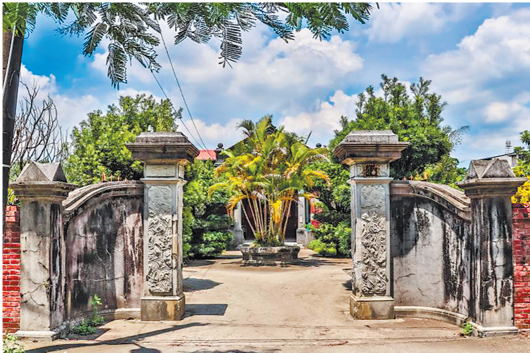
台湾里港蓝家古厝

洛阳桥保存诸多石碑石刻,自宋以来得以传世,两岸村民(尤其桥南刘氏)功不可没,因为大部分碑刻立在桥南,兴许是桥南地势较高的缘故,现今部分碑刻还转移到蔡公祠内进行保护,而桥北万安村的石碑相对较少,保留在昭惠庙里的多数是重修昭惠庙的石碑。