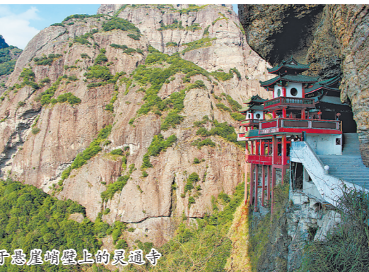
建于悬崖峭壁上的灵通寺