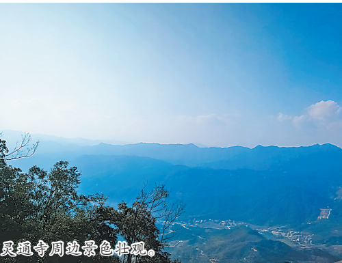
灵通寺周边景色壮观。

灵通寺生态环境极佳,具有悬崖与洞穴寺庙的双重特征,倚洞建寺,洞寺结合,集山、岩、洞、崖、瀑、泉、潭等景观于一体。