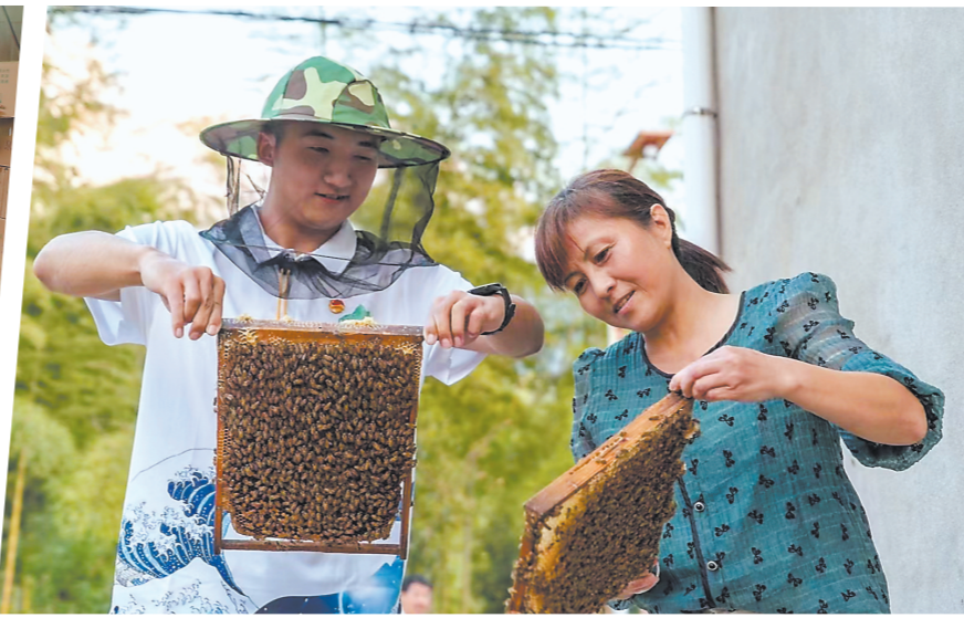
▲游客在管厝“四同”体验基地体验采收蜂蜜。 ▲在高门村蔬菜种植基地,工人将茄子、丝瓜等新鲜蔬菜分装打包。