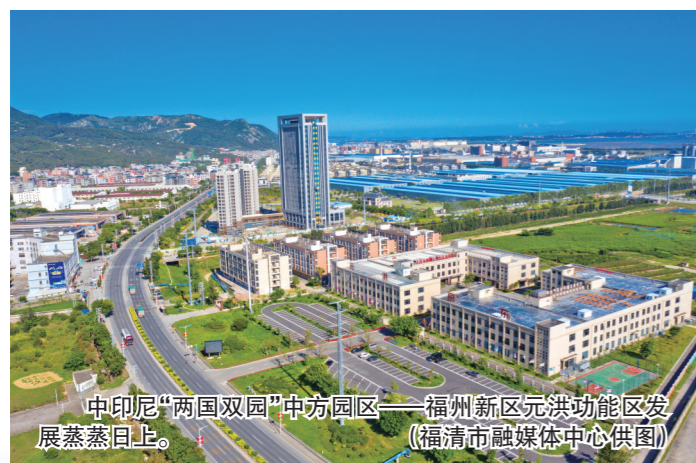
中印尼“两国双园”中方园区——福州新区元洪功能区发展蒸蒸日上。

随着一个个大项目、好项目建成，让福州新区成为热热闹闹、活力迸发的向往之地。福州滨海旅游区下沙片区项目建成后，在今年“五一”假期对外开放，并举办以“梦栖滨海踏浪追风”为主题的沙滩音乐节等系列活动，吸引众多市民游客打卡体验，首日人流即超8万人次，三天接待游客23.1万人次，跃居全省热门景区前十，为福州海洋经济、文旅经济发展注入强劲新动力。