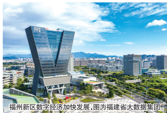
福州新区数字经济加快发展，图为福建省大数据集团。

八年来，福州新区坚持以龙头牵引、产业链招商为主线，以园区标准化建设为支撑，聚焦数字经济、新材