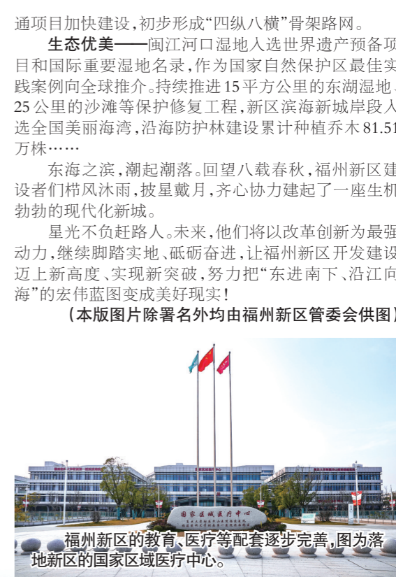
福州新区的教育、医疗等配套设施逐步完善，图为落地新区的国家区域医疗中心。