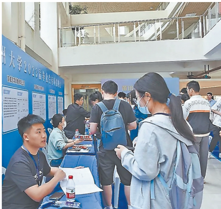
涵江区福州大学2023届毕业生专场招聘会

随着传统产业转型升级加速演进和战略性新兴产业发展,莆田正不断推出引才优才政策,驱动产业创新发展。 设立莆田市人力资源服务产业园;推进全市人才地图建设,建立全市12条产业链人才数据库;给予高层次人才创新创业人才(团队)最高400万元补助、个人最高200万元补助;针对12条重点产业链,吸引更多高校、科研院所参与产业链技术创新,重大项目按研发投入的30%给予补助;精准引进企业急需紧缺人才,对“双一流”