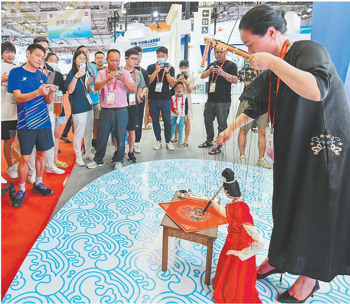
中国-中亚国家合作展区前,来自泉州的提线木偶传承人向观众展示提线木偶书法。

单丝不成线,孤木不成林。“和平、发展、合作、共赢”的历史潮流不可阻挡。在这个关键时刻,我们更要坚持同舟共济、团结合作,坚持开放合作、互利共赢,用好投洽会这把为全球投资开启财富之门的“金钥匙”,为促进全球经贸往来作出新贡献,为促进世界经济复苏注入新动能。