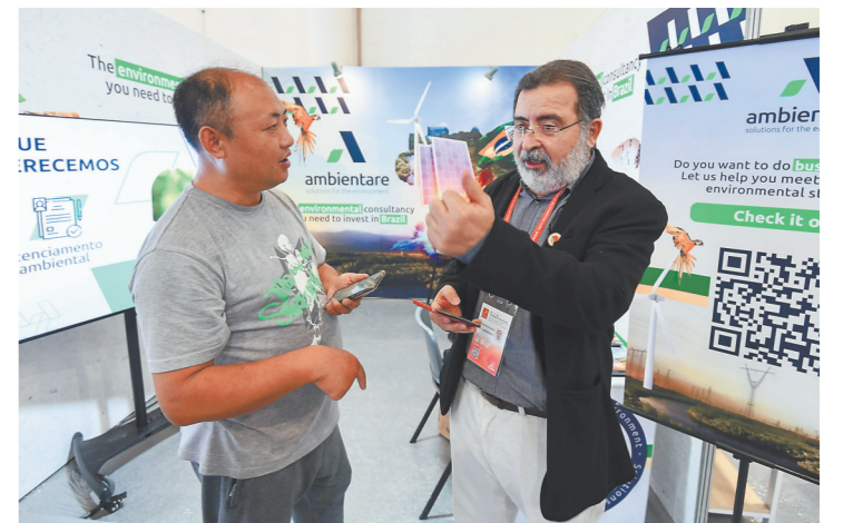
外国展商向中国客户介绍光伏和风电设备。