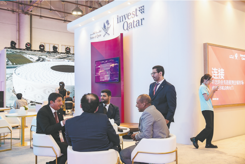
主宾国卡塔尔的国家馆内,客商在交谈业务。