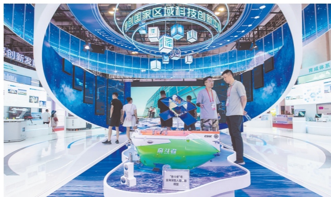
厦门科学城展区展出厦门在海洋科技、生物医药、新材料、人工智能等领域的创新成果。