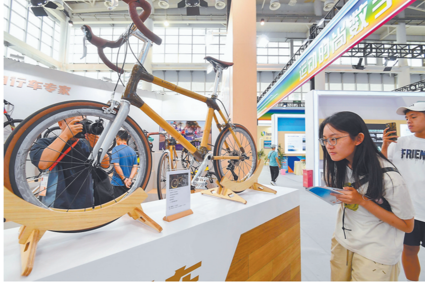
运动时尚展区展出的“竹”自行车,惊艳参观者。