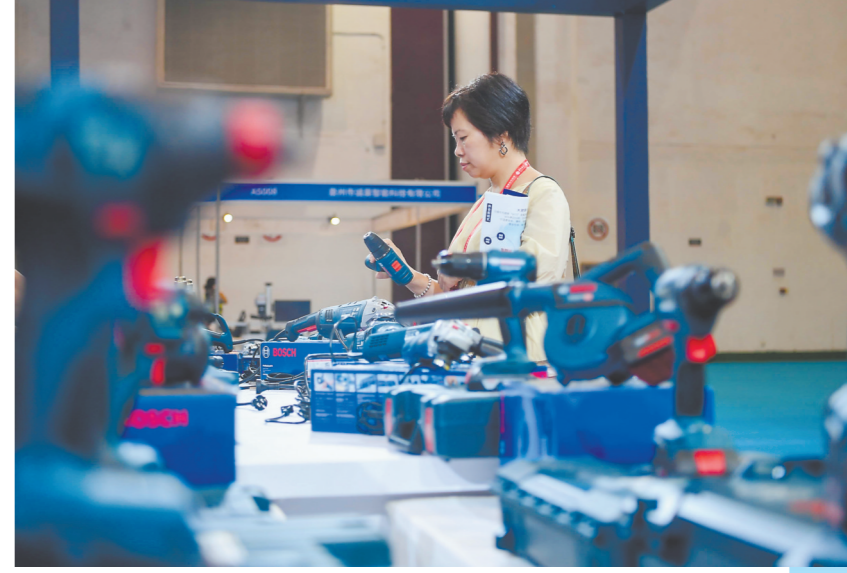
各式各样的电动工具颇受观众关注。