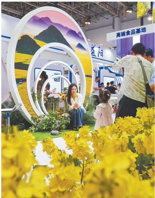
云南省曲靖市展馆繁花似锦,吸引观众留影。