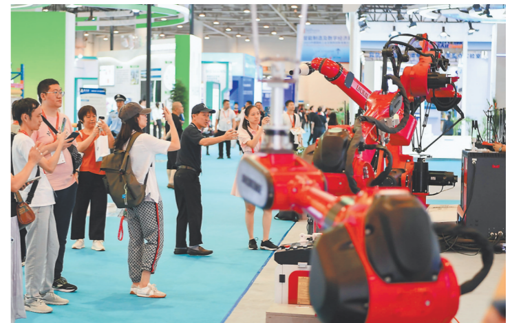
智能制造展区内,观众纷纷拿起手机拍摄各类机器人手臂。