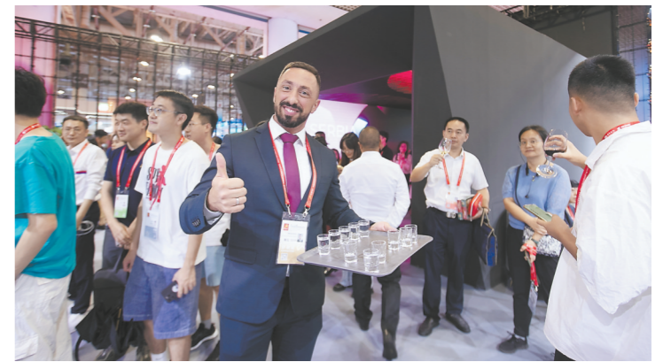
主宾国塞尔维亚的国家馆内,客商以美酒招待宾客。