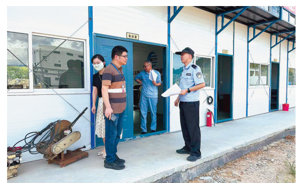
近日,南平市公安局延平分局开展深化流动人口服务管理专项行动,组织民警对出租房屋、沿街商铺、建筑工地等流动人口聚集区进行摸排走访,大力提升流动人口服务管理效能。

近年来,随着福安城区快速发展,越发密集的建筑压缩了城市空间。为了满足居民群众对美好生活的追求,福安结合民生基础设施补短板、城乡建设品质提升、省级文明城市创建等工作,扎实推动家门口的口袋公园建设,现已建成口袋公园10个,让市民有更多的空间享受大自然,进一步提升城市绿色的“幸福感”。