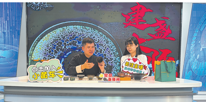
在南平市青年创业园党员“建盏间”,主播宣传建盏文化。

近年来,政和县探索“茶业+文旅”的发展模式,深入挖掘新茶、茶灯戏、当酒茶等本地特色茶文化;修复“龙焙贡茶”遗址和多条茶盐古道;策划推出“茶游学”“游古村、看茶艺”等茶旅路线,把中国白茶城、中国白茶博物馆、锦屏茶盐古道等纳入茶旅线路;位于政和高山区的云根茶业公司,开展高山白茶寻茶之旅、茶游学等活动,吸引一批批茶友走进政和,前来游学。同时县里加快推进罗金山茶旅康养、瑞和茶庄园等茶旅融合项目落地。