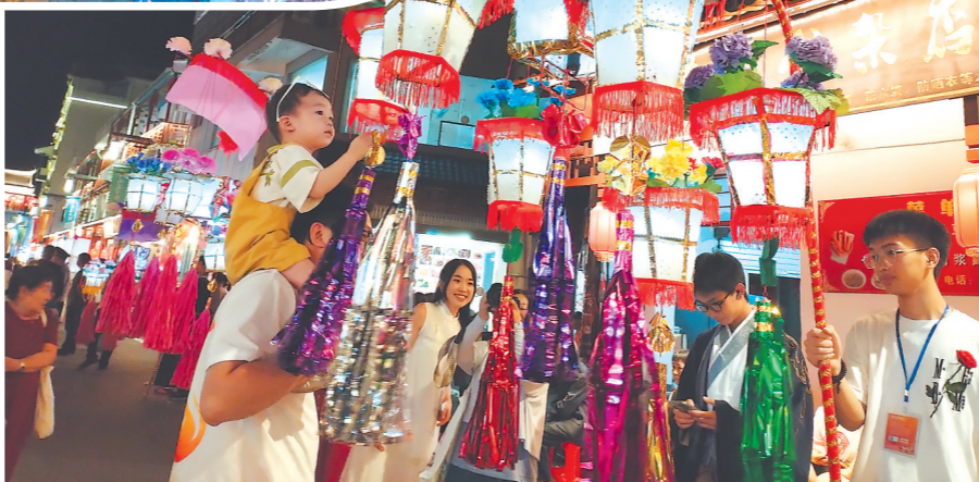
▼游客驻足观看花灯。