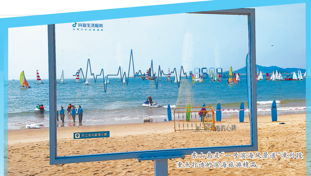
东山岛是“一号滨海风景道”漳州段重点打造的滨海旅游精品。

在平潭综合实验区,不少游客趁着假期慕名来到当地最火热的打卡点之一——68海里景区。这里与台湾新竹市南寮渔港直线距离仅