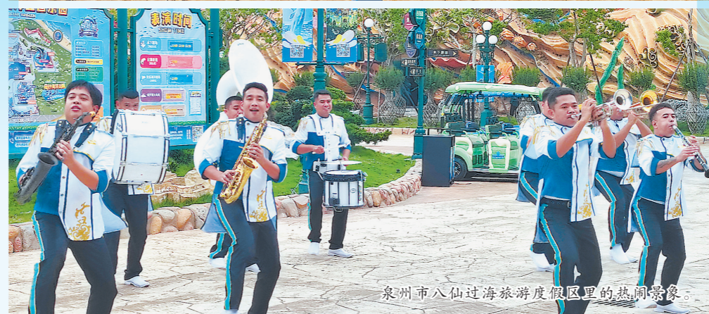
泉州市八仙过海旅游度假区里的热闹景象。