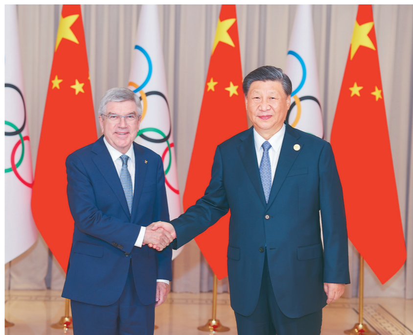
9月22日下午,国家主席习近平在杭州西湖国宾馆会见来华出席第19届亚洲运动会开幕式的国际奥林匹克委员会主席巴赫。

新华社杭州9月22日电 9月22日下午,国家主席习近平在杭州西湖国宾馆会见来华出席第19届亚洲运动会开幕式的国际奥林匹克委员会主席巴赫。