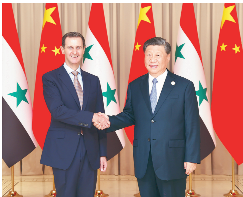
9月22日下午,国家主席习近平在杭州西湖国宾馆会见来华出席第19届亚洲运动会开幕式的叙利亚总统巴沙尔。

新华社杭州9月22日电 9月22日下午,国家主席习近平在杭州西湖国宾馆会见来华出席第19届亚洲运动会开幕式的叙利亚总统巴沙尔。两国元首共