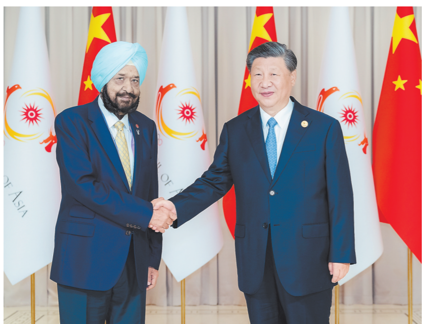
9月22日下午,国家主席习近平在杭州西湖国宾馆会见来华出席第19届亚洲运动会开幕式的亚洲奥林匹克理事会代理主席辛格。

辛格表示,我谨代表亚奥理事会对中国政府长期支持亚洲奥林匹克事业发展以及举办此次杭州亚运会表示衷心感谢。杭州各种场馆设施都十分漂亮先进,令人印象深刻,运动员们非常满意。