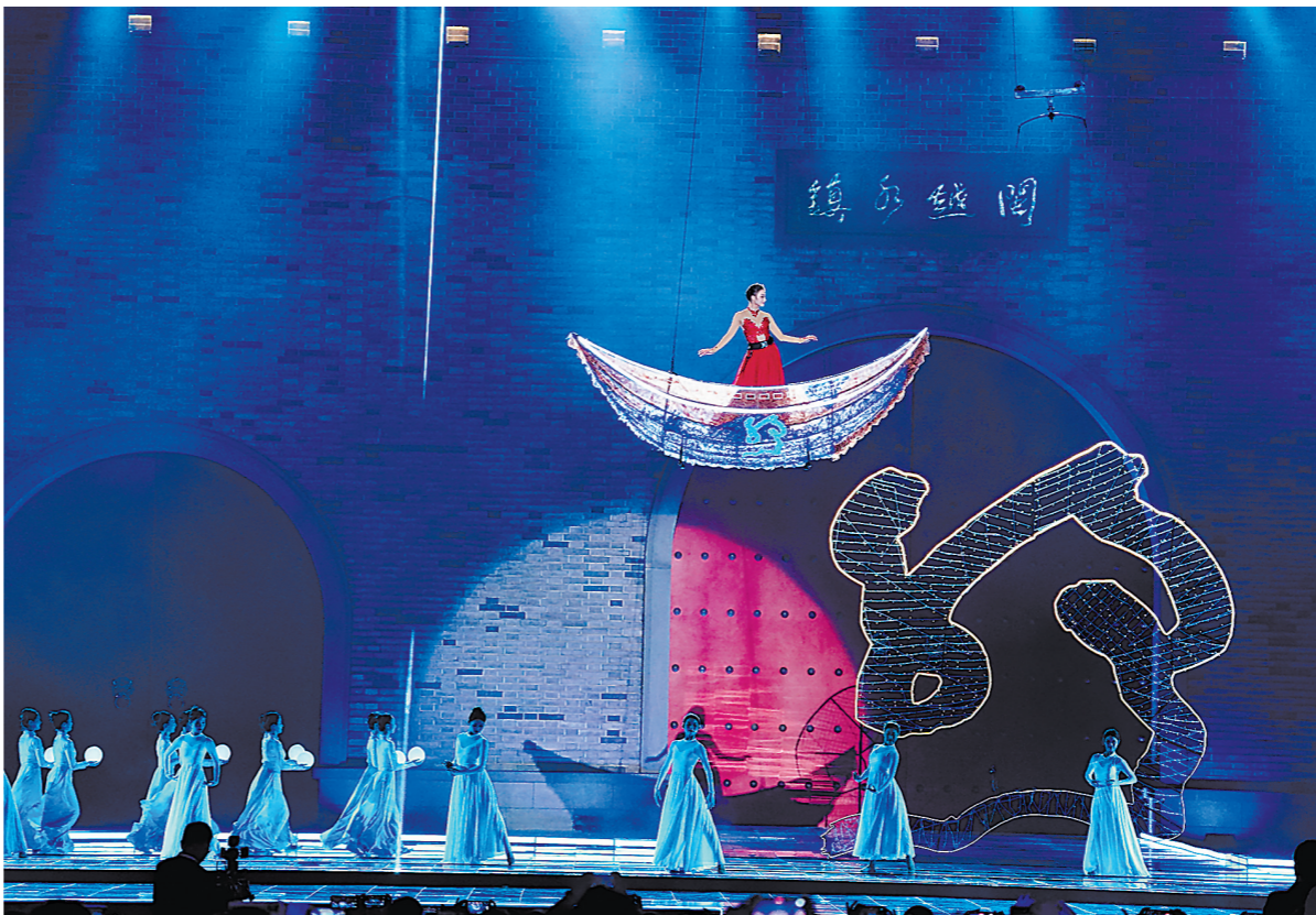
启动仪式上的歌舞表演《一路同心》

由同名小说改编的电影《沙漏》,以福州为主要拍摄取景地。启动仪式的剧组推介环节,当这部电影的演员黄明昊发言时,现场响起一片热烈的掌声。“我在这部电影中的角色,内心世界比较复杂,与以往的角色有很大不同。希望大家到电影院支持这部电影。”黄明昊说。 著名演员邵兵参演的《你是我的英雄》,同样参加了剧组推介环节。这部电影主要讲述福建省登山协会山地救援队的故事,剧本创作和拍摄都在福州完成。“为了表现山地救援队的经历,我们付出了很多,希望大家喜欢。”邵兵说。 丝路电影节举办十年来,福建电影艺术创作和电影产业发展都取得了长足进步,取得历史最好成绩。近年来,福建电影创作推出了《古田军号》《中国乒乓之绝地反击》等一批兼具社会效益和经济效益的精品力作,参与出品的《我和我的祖国》《我和我的父辈》荣获第十六届“五个一工程”特别奖等奖项。 截至今年8月底,全省现有电影院406家,电影银幕2351块、座位318338个,人均银幕数、座位数居全国前列。今年暑期档,福建电影票房首次突破7亿元,观影场次首次突破100万达到107万场,观影人次1742.35万人次,是福建电影史上最好的暑期档。 在启动仪式的“丝路十年 有福电影”十周年成果发布环节,《守岛人》主演黄明昊发言时,现场响起一片热烈的掌声。“我在这部电影中的角色,内心世界比较复杂,与以往的角色有很大不同。希望大家到电影院支持这部电影。”黄明昊说。