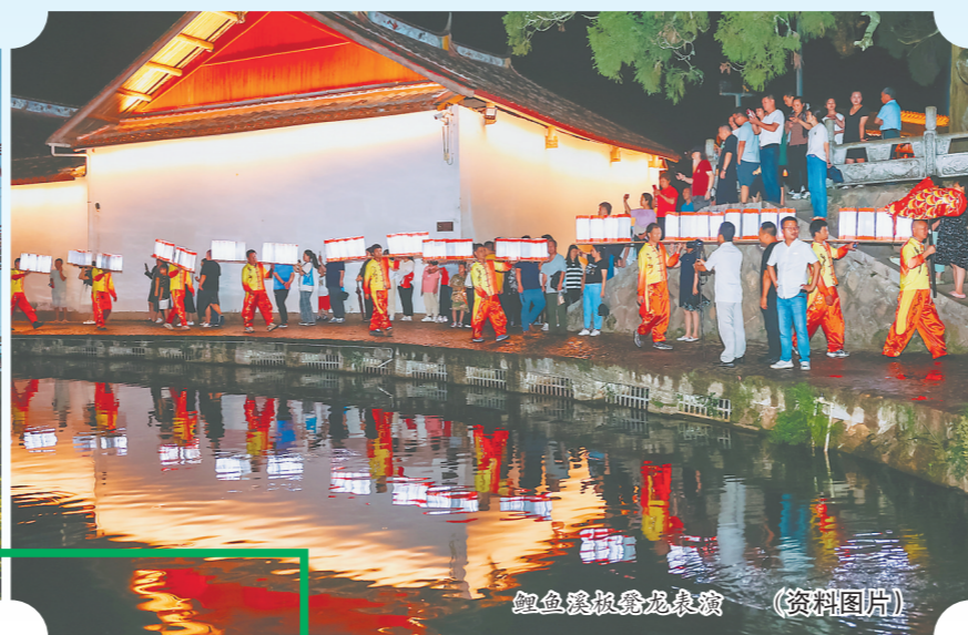
鲤鱼溪泼水节(资料图片)