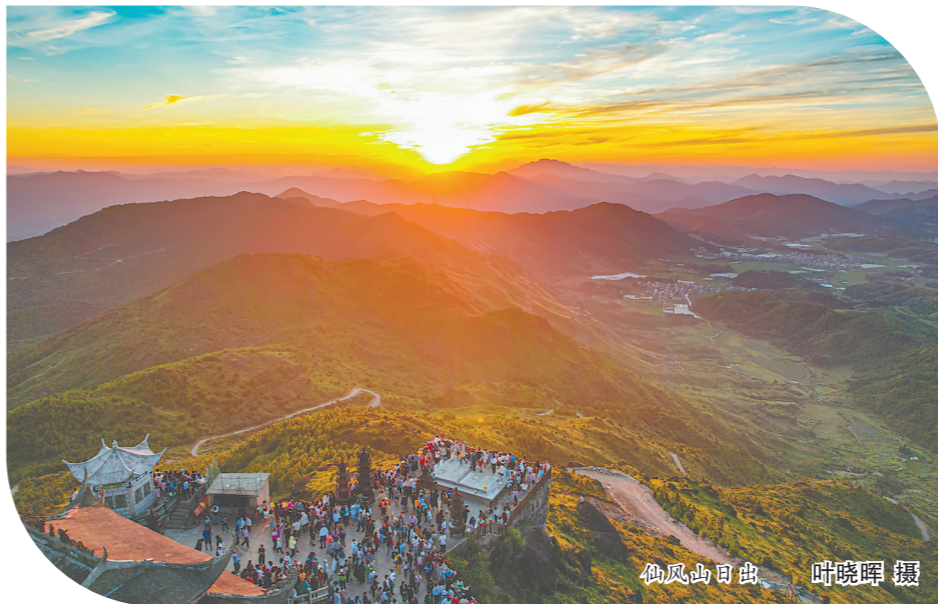
仙风山日出