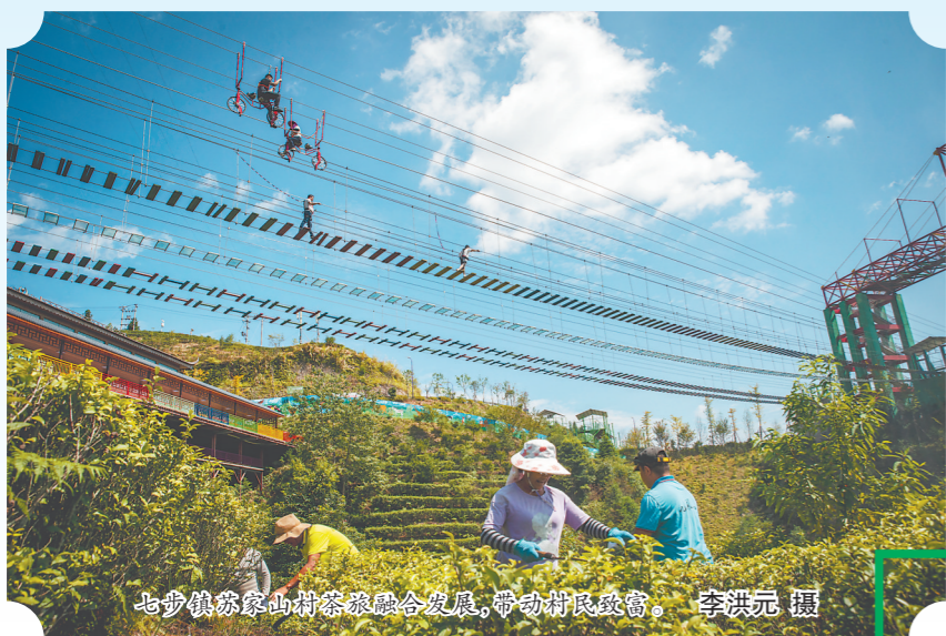
七步镇苏家山村茶旅融合发展,带动村民致富。