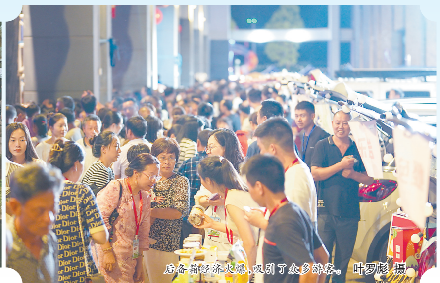
后备箱经济火爆,吸引了众多游客。