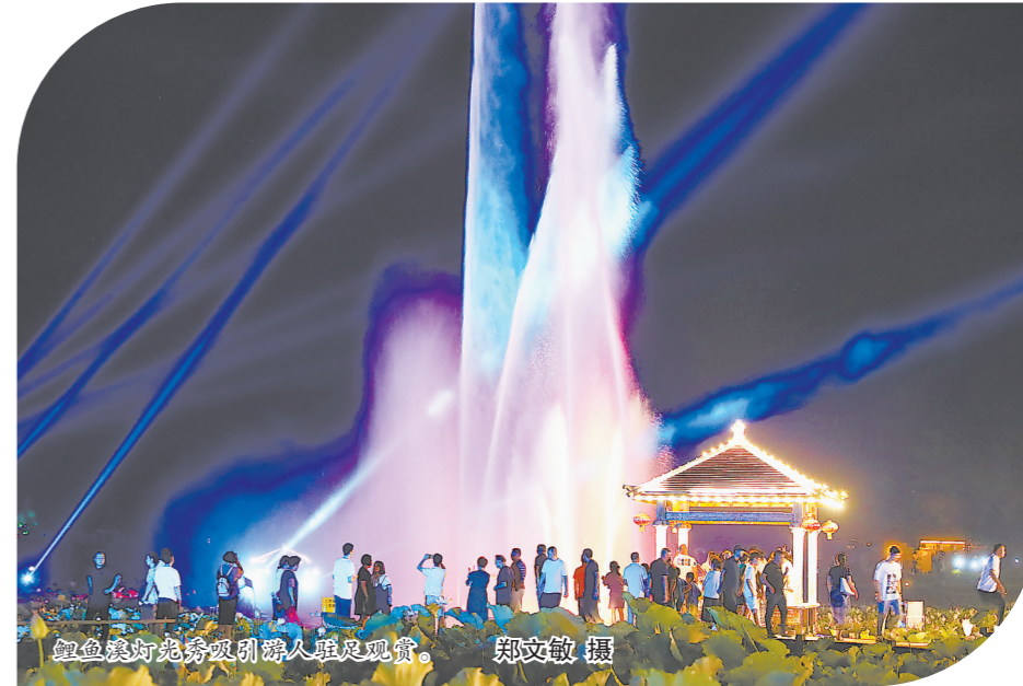
鲤鱼溪畔绝美夜景吸引游人驻足观赏。

周宁县探索“旅游+”新模式,创新旅游业态,丰富旅游产品,延伸产业链条,推出一批精品旅游线路,全域越来越有“游头”。