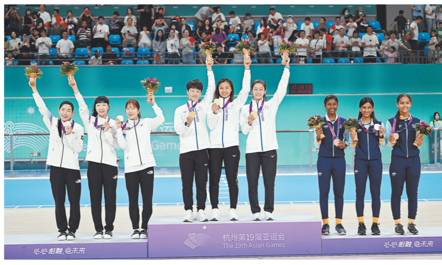
10月2日,获得亚运会轮滑项目女子速度轮滑3000米接力赛冠军的中国台北队(中)、亚军韩国队(左)、季军印度队在颁奖仪式上合影。