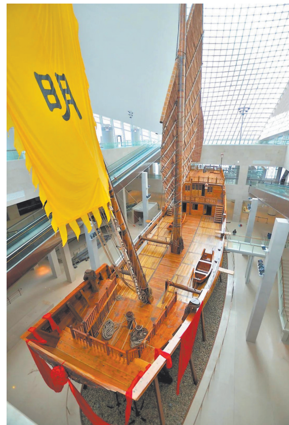
以郑和船队中的海船为原型、仿照明代福船的样式复刻而成的船模

在千百年的海洋文明史里,福船见证着福建先民乘风破浪的辉煌过去。时至今日,福船技艺及其折射的匠人精神与角逐海洋的勇气,依旧焕发着活力,指向更远的远方。