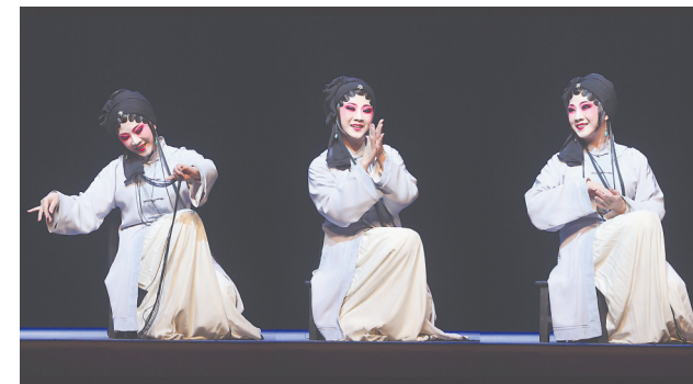
由文旅部、江苏省人民政府主办的2023年戏曲百戏(昆山)盛典日前在江苏昆山隆重开幕。开幕式专场演出由多位业界领军人物、戏曲名家担纲。其中,“二度梅”获得者、来自福建省梨园戏传承中心的曾静萍表演了梨园戏《吕蒙正·煮糜》,展现了福建地方戏曲剧种的芳华。因为曾静萍表演梨园(合成图片)。