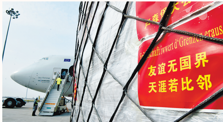
运送防疫物资的郑州—卢森堡航线货机在中国郑州新郑国际机场装机准备起飞(2020年3月22日摄)。