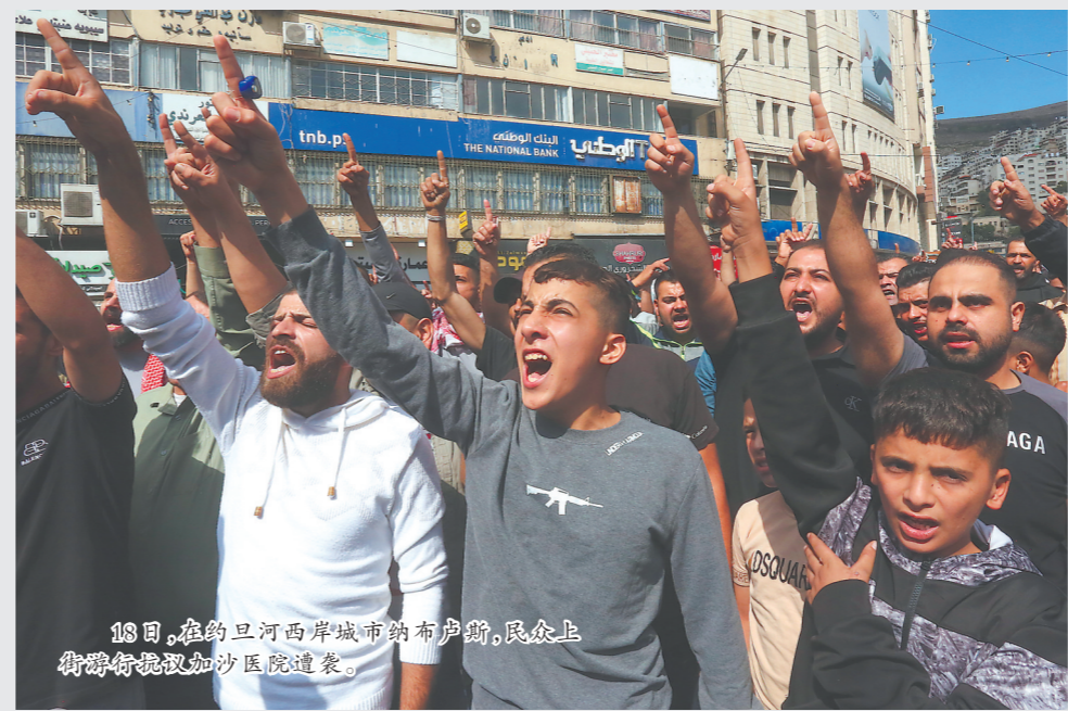
18日,在约旦河西岸城市纳布卢斯,民众上街游行抗议加沙医院遭袭。