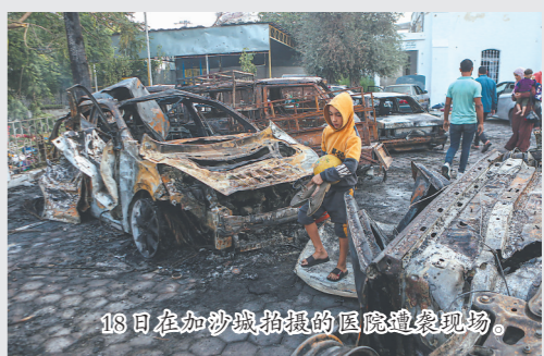
18日在加沙城拍摄的医院遭袭现场。