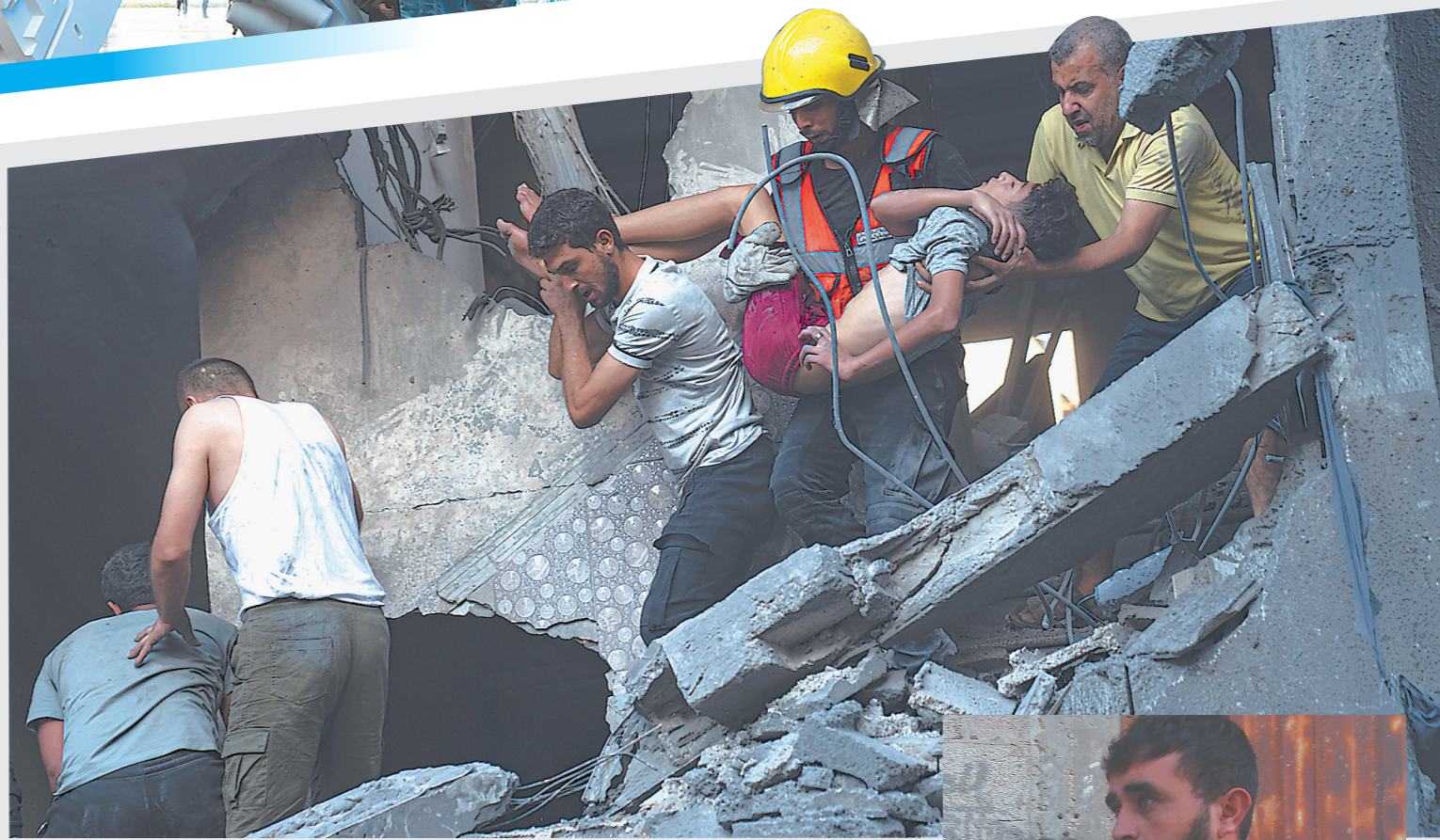
19日,在加沙地带南部城市汗尤尼斯,人们在遭以色列袭击后的建筑废墟中救援伤者。

土耳其卫生部长法赫丁·科贾18日在社交媒体上说,土耳其已经准备好向加沙地带居民提供医疗服务。 联合国教科文组织17日发布新闻公报说,近期中东地区紧张局势升级,对记者安全造成严重威胁。该组织呼吁各方立即行动,尊重和维护国际法。