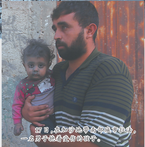
17日,在加沙地带南部城市提法,一名男子抱着受伤的孩子。