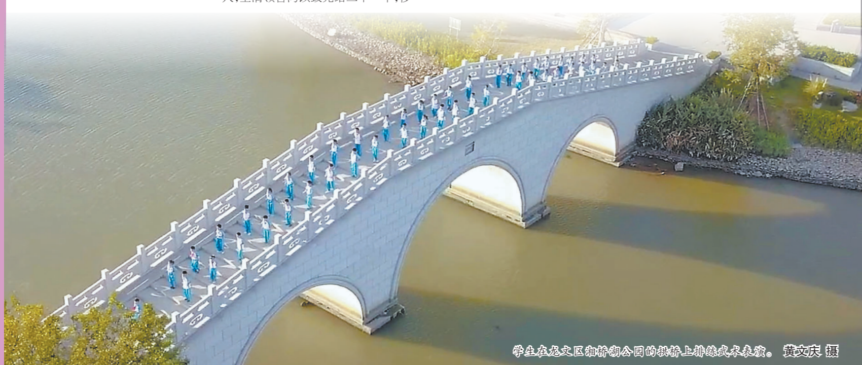
学生在龙文区和桥湖公园的拱桥上排练武术表演。