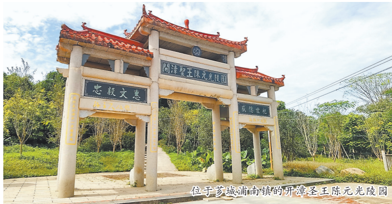
位于芗城浦南镇的开漳圣王陈元光陵园

日前,漳州市政协举行专题议政性常委会会议,围绕“挖掘弘扬祖地文化,助推开漳圣王文化园建设”进行协商议政。