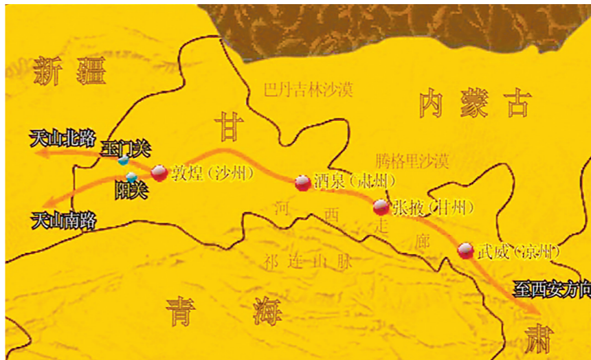
西汉河西走廊区域