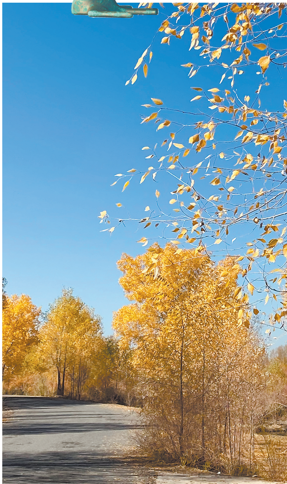
武威风光

当我从武威飞回福州长乐机场时,看到大厅里挂满了全省九设区市的文化口号,设计精美,灯箱光亮。恕我记性差,只记得有几个城市的八个文字中,除了城市名,六个字中都在“美丽”“美的”这么叫着。如何改变这种词穷的尴尬呢?我觉得产生城市口号的创意者,可以有此“三观”:有“仰观宇宙之大,俯察自身之异”的空间观,有“盖将自其变者而观之,则天地曾不能以一瞬”的时间观,有“马踏飞燕”那样自在奔腾、凉州词曲那般雄浑厚重的文化观。用此“三观”,记者敢竭诚杯,为武威之行恭疏一言:“马踏飞燕,威武凉州。”