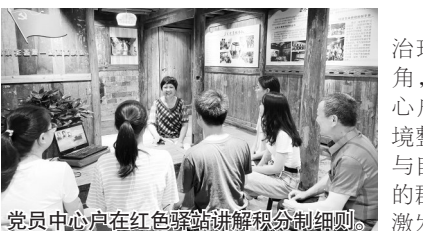
党员中心户在红色驿站讲解积分制细则。

柘荣县富溪镇积极拓展党建引领多元治理渠道,不断延伸“积分制”服务管理触角,结合网格化服务管理,通过选树党员中心户,试行“星级示范户”动态管理,围绕环境整治、睦邻爱家、平安和谐、诚信从业、参与自治五个方面开展评比活动,获评示范户的群众可凭积分在诚信超市兑换物资,着力激发群众参与乡村治理的积极性。 □专题