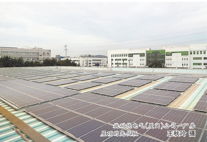
火炬高新区屋顶的太阳能光伏板。

通过智能灌溉系统提高灌溉效率,每年可节约水资源5000吨;厂房屋顶变身“发电站”,企业每年享受节约电费超7万元等的“阳光福利”……透过一个个实实在在的数据,厦门火炬高新区绿色低碳园区建设背后的“绿色密码”变得生动可感。