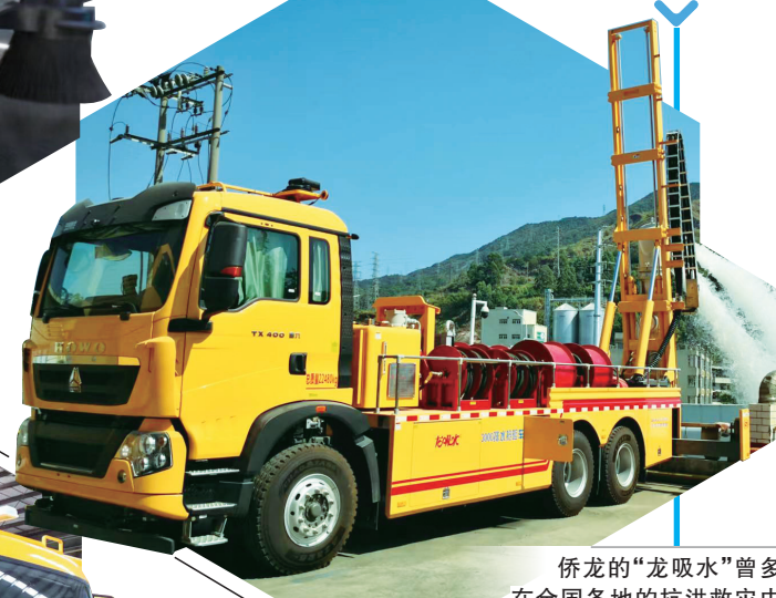
侨龙的“龙吸水”曾多次在全国各地的抗洪救灾中发挥重要作用。