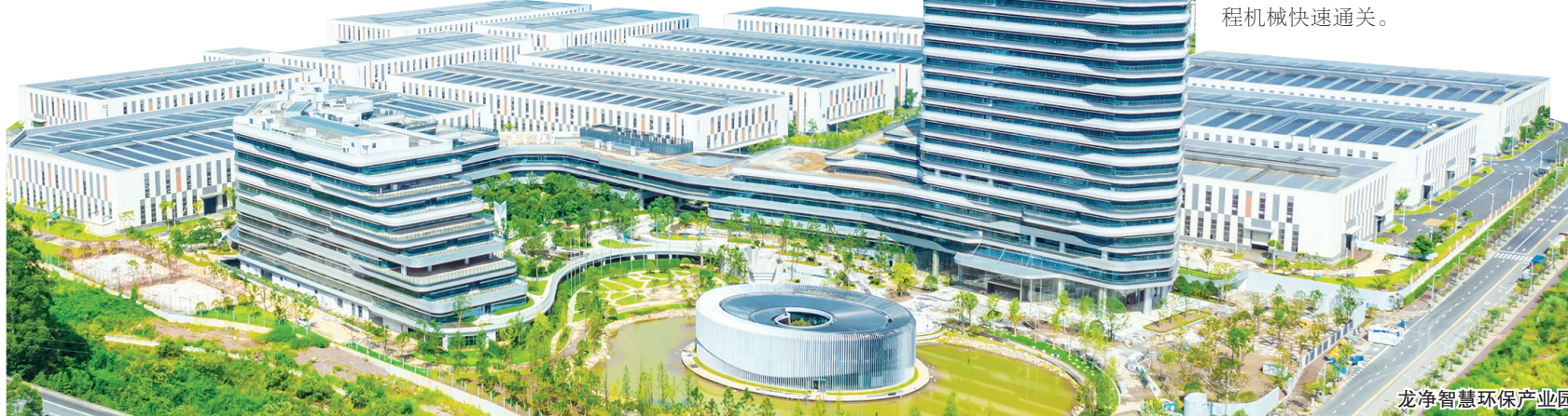
龙净智慧环保产业园

针对工程机械体积较大、装卸费时、国际标准化体系繁杂等特点,龙岩海关不断优化监管服务,在出口前主动对接企业生产计划,梳理出口国技术标准要求,全流程加强政策指导;在通关时,指导企业运用提前申报、抵港直装等政策,提供预约查验服务,助力工程机械快速通关。