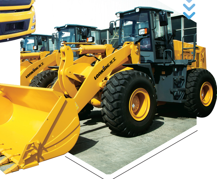
龙工装载机销量十几年排名全国第一。