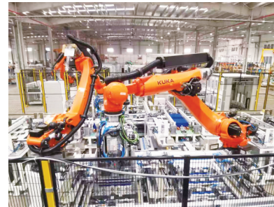
龙净蜂巢新能源电池储能模组PACK和系统集成项目