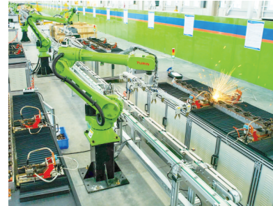
电除尘针刺线智能制造车间