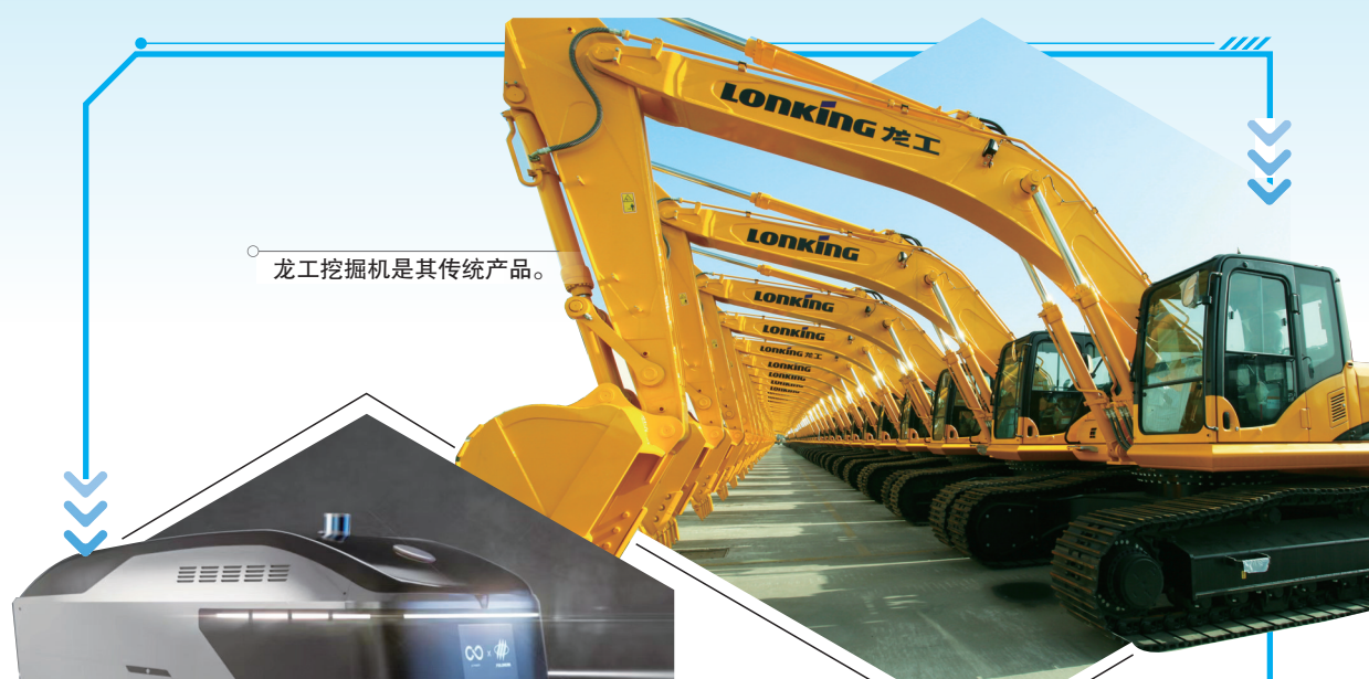
龙工挖掘机是其传统产品。

“十四五”以来,龙岩机械装备产业锚定智能化、数字化发展方向,在“龙岩制造”到“龙岩智造”的产业升级道路上稳步迈进,稳步进军千亿级机械产业集群。