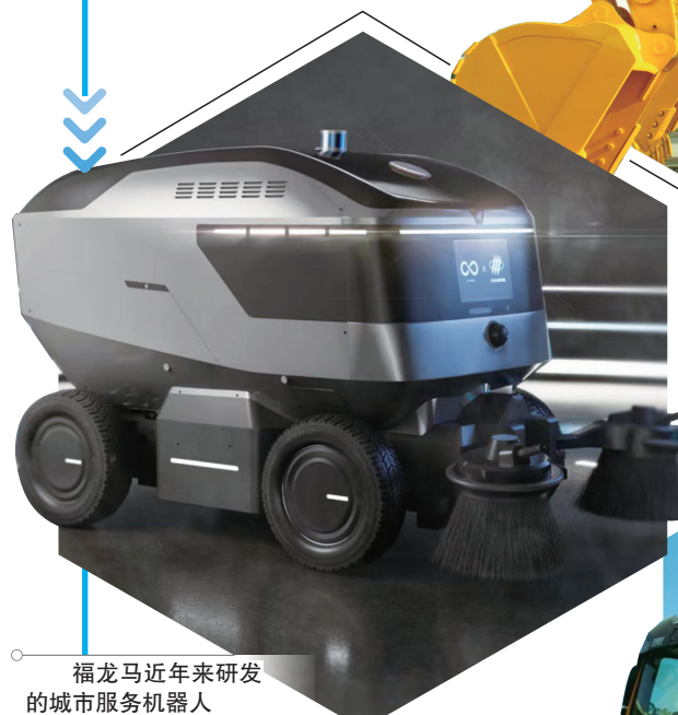
福龙马近年来研发的城市服务机器人