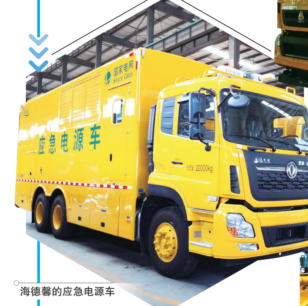
海德馨的应急电源车