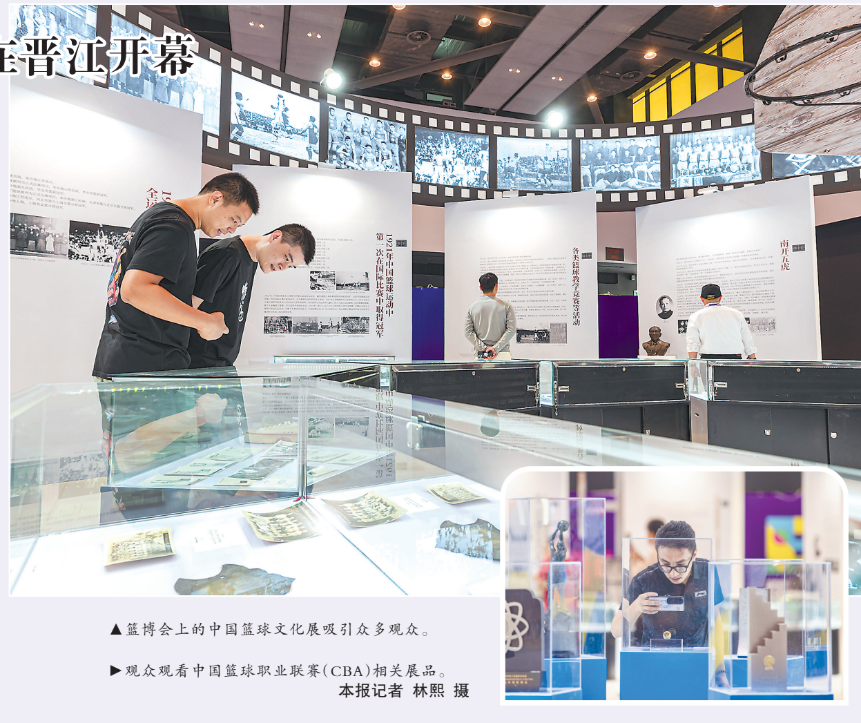
▲篮博会上的中国篮球文化展吸引众多观众。

中国篮协主席姚明曾在采访中表示,篮博会是为所有人创造共享篮球发展成果、分享篮球快乐的平台,将有机会成为中国体育发展创新的新模式。