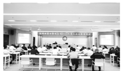
2023年4月,公司开展2023年党风廉政建设教育专题培训。

用好用活“正心正念”管理理念,贯彻习近平新时代中国特色社会主义思想,从“立正心、持正念、促正行、走正道、修正果”五个方面引导干部职工在思想上固本培元,在纪律上模范遵守,在履责上当担当,护航企业健康发展。用好用活新时代文明实践点,发挥电网企业贴近群众、联系千家万户的优势,采取劳模宣讲进班组等载体,结合理论宣讲、志愿服务活动等,把新风正气送到千家万户。用好用活地方特色资源,组织前往泉州(南安)党员教育基地等红色阵地,通过主题教育现场教学、“三正”践行活动、主题党日等方式,踏寻红色足迹,坚定理想信念,凝聚奋进的力量。