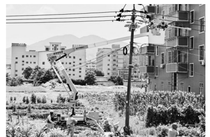
2023年8月,公司带电班在田地上顶着烈日穿着厚重绝缘服开展不停电作业。

工”开展电力特色志愿服务85次425人次,3个案例入选省市公司“双满意”典型案例,不断擦亮南电“双满意”名片,着力形成以文明实践助力乡村振兴、基层治理和人民美好生活的南安电网模式。 (黄仁娜) □专题