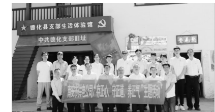
2023年7月,公司前往中共德化支部旧址开展“存正心、守正道、养正气”主题活动。

今年以来,国网南安市供电公司围绕“存正心、守正道、养正气”主题,秉承“人民电业为人民”的企业宗旨,发挥电力特色优势,聚焦民生热点,开展内容丰富、形式多样的“岗位践新风”系列活动,努力打造具有南电特色的电力“双满意”名片,为服务地方经济社会发展展现“南电担当”。