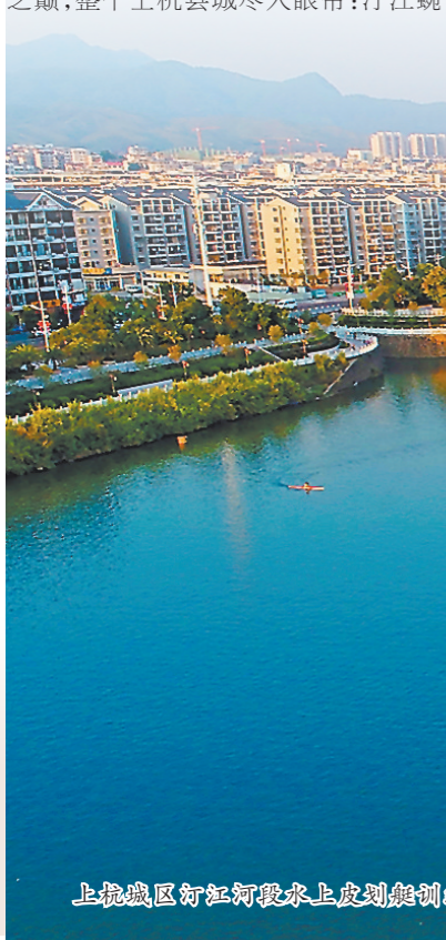
上杭城区汀江河水上皮划艇训练。

蜿蜒而过,浓浓绿意中高楼层立屋舍俨然,好一幅“四面青山三面水,一城如画夕阳中”的秀美小城景象。