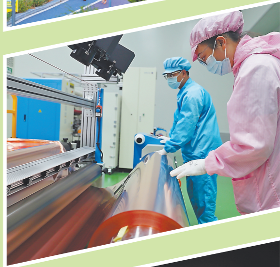
上杭晶旭半导体生产车间