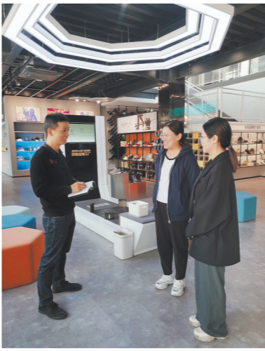
▲荔城区工信局党员干部(左)在双轮公司个性化定制示范工厂征求意见。 ▲荔城区西天尾工业园鞋服中小企业集聚区

为加快培育一批鞋服人才,莆田市荔城区于近日推出十一条举措。专门出台鞋服行业的人才措施,在该市尚属首次。 从今年4月开始,荔城区结合主题教育,以“四下基层”为抓手,由主要领导挂帅,成立鞋服人才工作专班,开展鞋服行业人才专题调研,组织党员干部走访机关单位、工业园区、重点企业60多人次,征求意见建议100多条,前后历时半年多才完成前期调研工作。 鞋服是莆田市首个产值超千亿元产业,其中荔城区鞋服产业比重占全市近一半。近年来,荔城区从人才支撑、项目建设、营商环境等方面发力,推动鞋服产业转型升级,释放集聚效应。今年10月,福建省第二批中小企业特色产业集群名单公布,荔城区运动休闲鞋产业集群榜上有名。