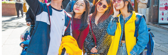
参访团成员在福州三坊七巷合影留念。