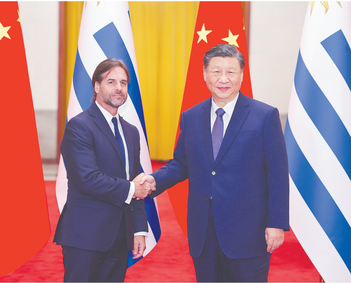
十一月二十二日下午,国家主席习近平在北京人民大会堂同乌拉圭总统拉卡列举行会谈。