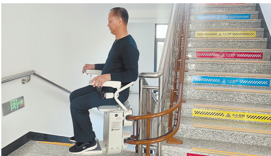
闽清县工人文化宫新增电动爬楼装置。