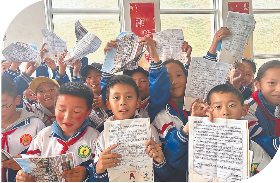
协雄乡小学的藏族学生展示收到的信件。