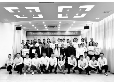
福鼎市前岐镇主题教育知识竞赛决赛合影

此次知识竞赛紧紧围绕习近平新时代中国特色社会主义思想、党的二十大精神,主题教育应知应会等多项内容展开,来自前岐镇35个党支部的78名党员干部经过初赛闭卷笔选拔,有8支代表队的24名选手脱颖而出,进入现场决赛,并特别邀请宁德市直机关年轻干部“四下基层”福鼎实践队队员与前岐镇知识竞赛选手们同台竞技、比学赶超。