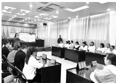
福鼎市前岐镇主题教育知识竞赛决赛现场

加知识竞赛活动,让他们各方面都得到锻炼。在今后的学习中,要进一步把习近平新时代中国特色社会主义思想蕴含的立场观点方法切实转化为武装头脑、指导实践、推动工作的强大动力,强本领,提能力,为前岐高质量发展贡献力量。