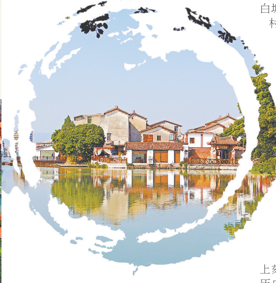
▲罗莆田红砖厝建筑群

步换景别有洞天。负责打理茶舍的店主施丝是土生土长的涵江人,罗莆田蕴含的独特水乡、商贸文化底蕴,让她和其他三位高中好友一直痴迷其中。茶舍不仅普及茶文化、提供茶产品,还提供社交、办公空间,很好地拥抱了新生代消费者。