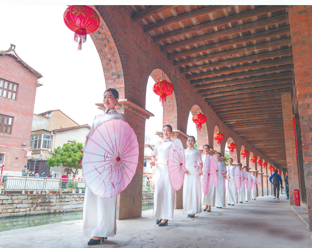
东方廿五坎里的旗袍秀 (资料图片)