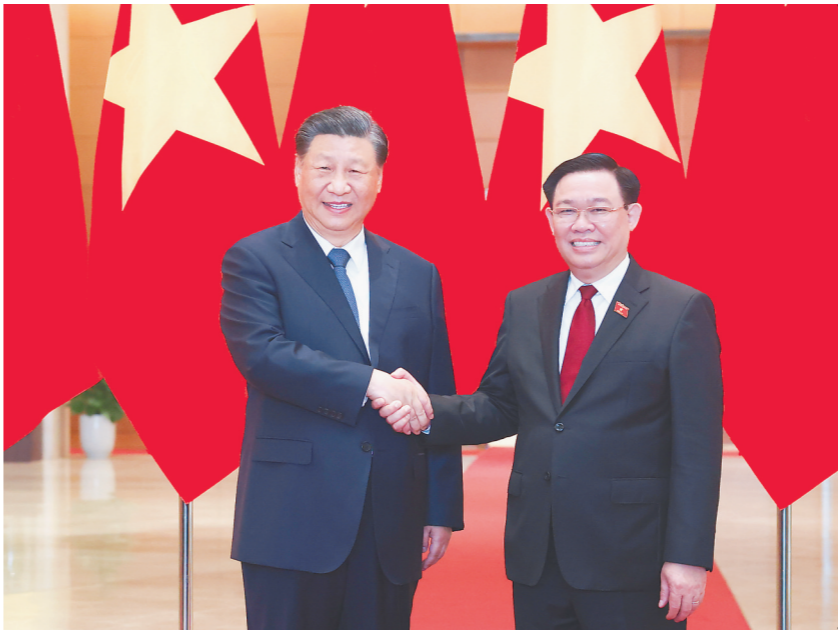
当地时间十二月十三日上午，国家主席习近平在河内会见越南国会主席阮庭惠。