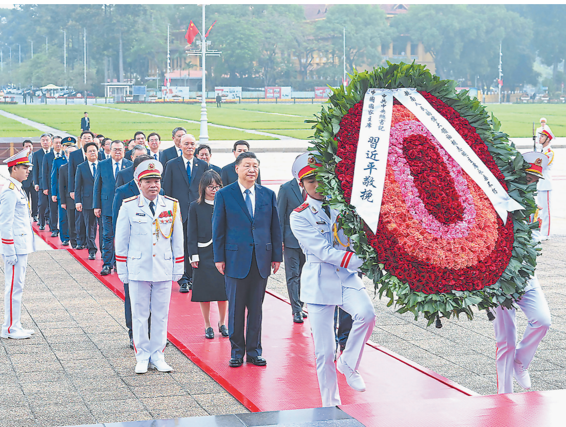
当地时间12月13日上午，中共中央总书记、国家主席习近平在河内瞻仰胡志明陵并敬献花圈。

(上接第一版)中方愿同越方加强沟通协调，找到双方都能够接受的海上问题长久解决办法，推动各方早日达成实质、有效的“南海行为准则”，为地区和平稳定作出更大贡献。