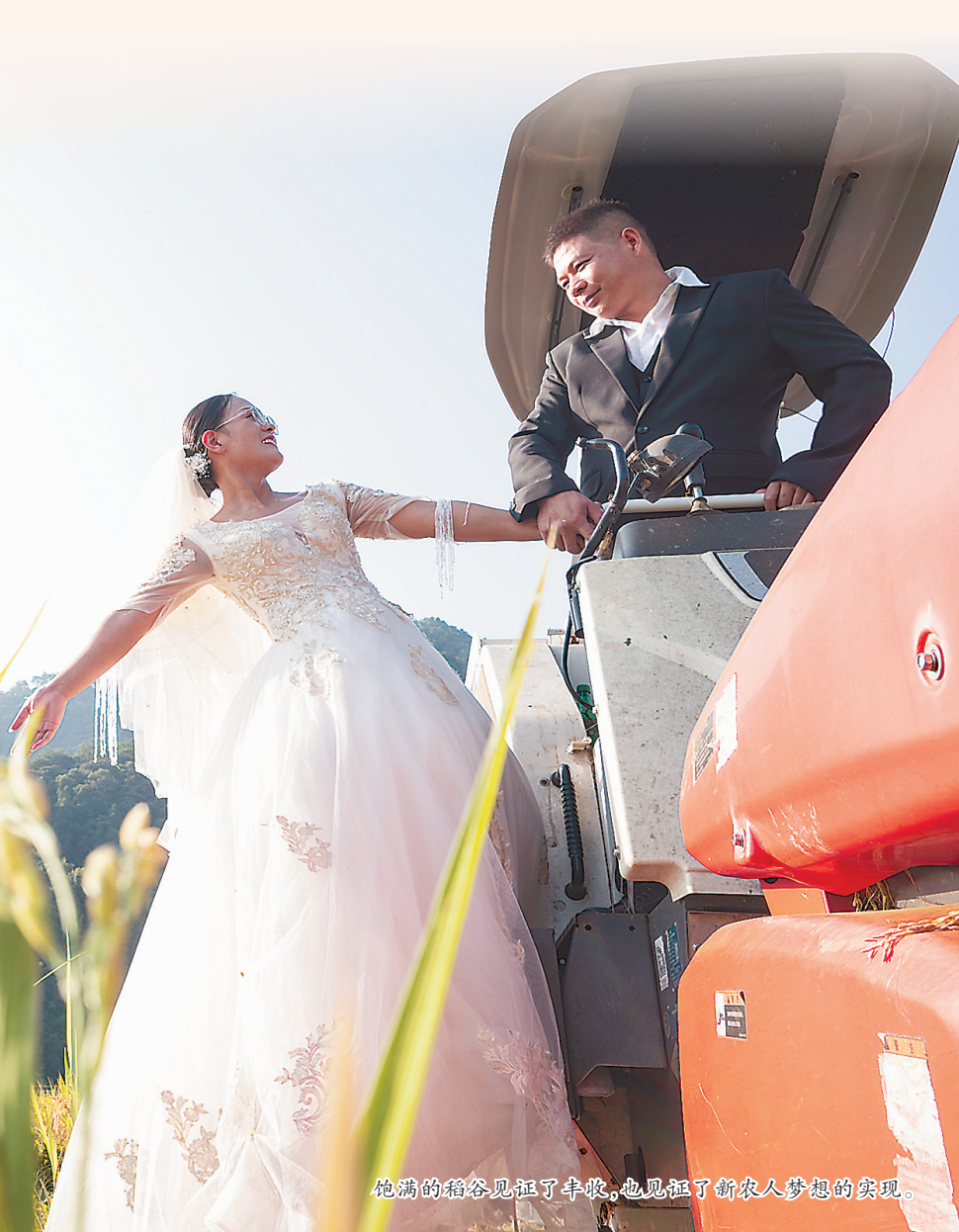
饱满的稻谷见证了丰收,也见证了新农人梦想的实现。