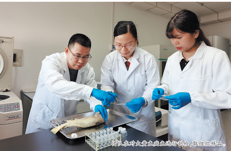
团队在对尖吻鲟进行剖检,取组织样品。