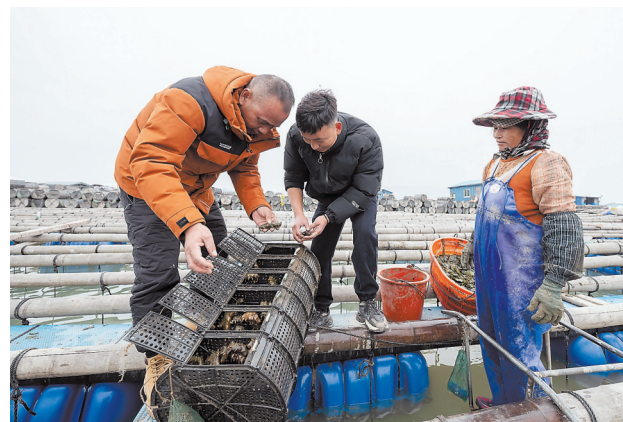
入冬以来，近万车来自山东、辽宁、河北等地的半大海参苗“南迁”至霞浦过冬。图为在霞浦县澳南镇海域的渔排上，海参养殖户察看海参长势。据统计，2022年，霞浦海参产量达5.5万吨，总产值72亿元，约占全国成品参的30%。截至目前，全县采购北方海参苗种量已达去年苗种采购量的180%，养殖规模增速明显。