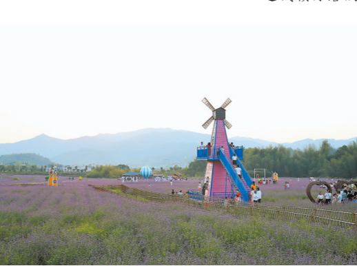
上杭古田镇欢乐谷