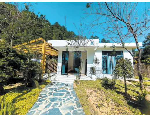
新罗区江山镇双车村新建的温泉民宿