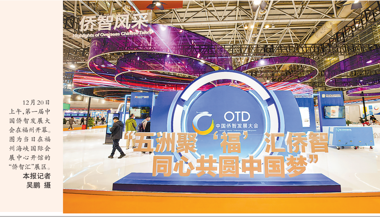
12月20日上午，第一届中国侨智发展大会在福州开幕。图为当日在福州海峡国际会展中心开馆的“侨智汇”展区。

省长赵龙赴漳州现场督导典型案例通报问题整改工作，强调要认真落实中央生态环境保护督察组要求，坚持立行立改，压紧压实责任，切实整改到位，扎实做好生态环境保护和生态环境保护各项工作，坚决守护好绿水青山，实现高质量发展。 连日来，九市一区党政领导“一把手”纷纷带队赴一线调研，进社区、访企业、探工地……及时回应百姓诉求，开展现场督办。 高位推进，以上率下，这是福建落实中央生态环境保护督察工作部署的高度自觉，也是福建坚持生态环境保护责任“党政同责”“一岗双责”的一贯作风。 (下转第六版)