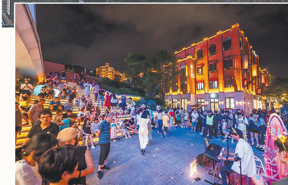
▲年轻人在烟台山打开一种全新生活方式。