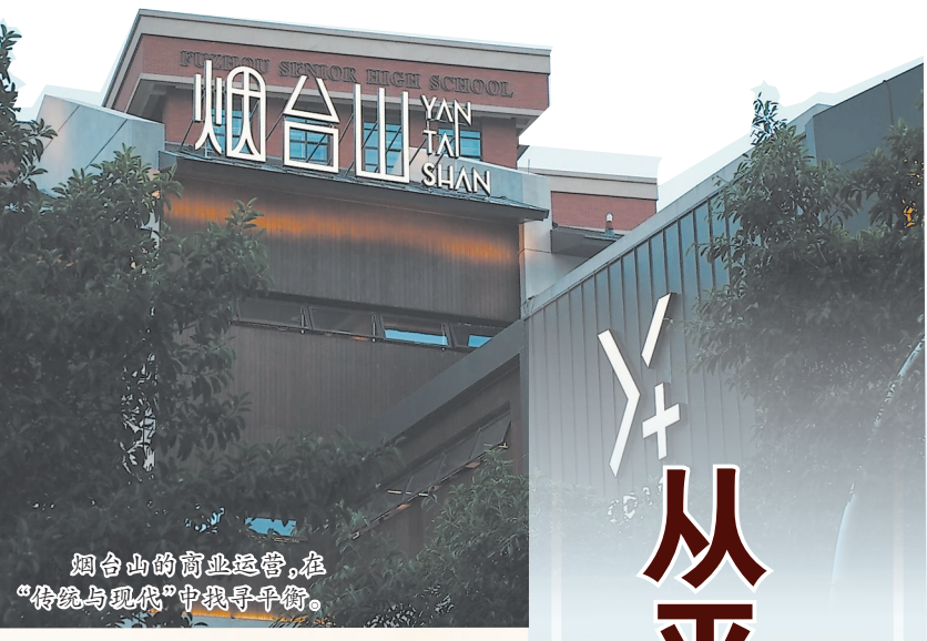
烟台山的商业运营,在“传统与现代”中寻找平衡。