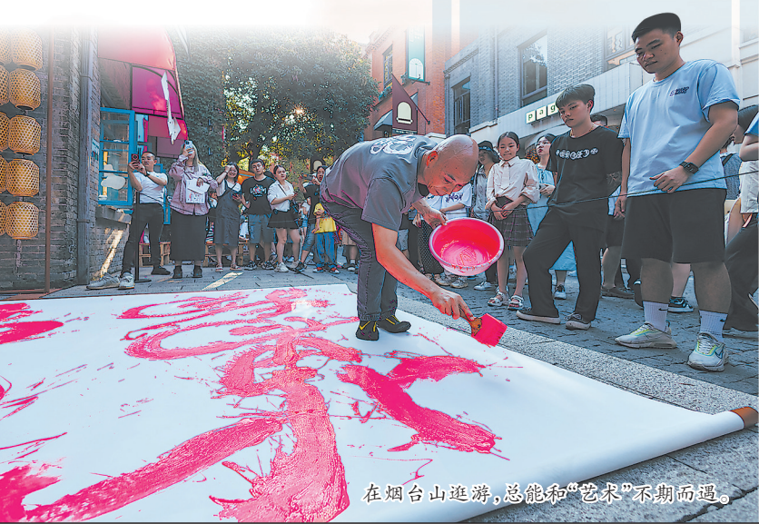
在烟台山逛游,总能和“艺术”不期而遇。