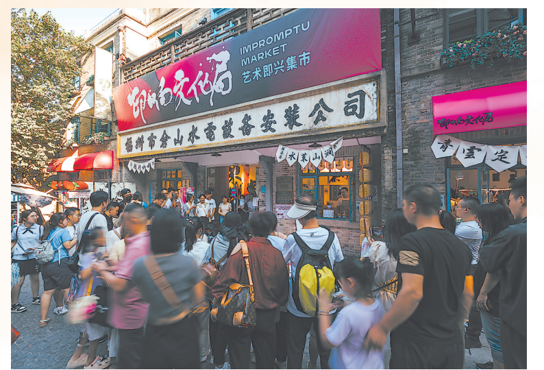
▲烟台山商业漫步街区流量火爆。