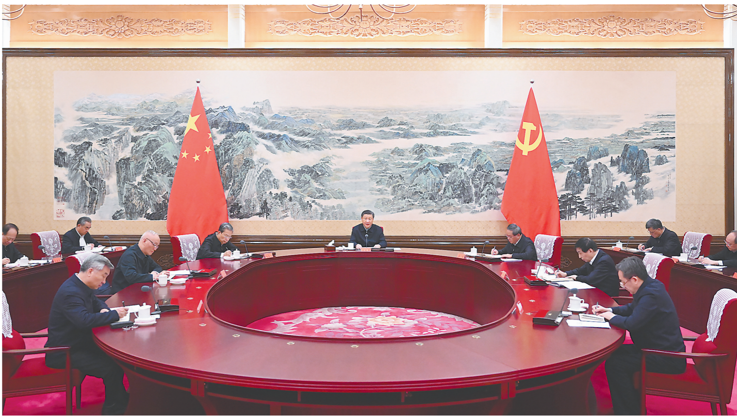
12月21日至22日,中共中央政治局召开学习贯彻习近平新时代中国特色社会主义思想主题教育专题民主生活会,中共中央总书记习近平主持会议并发表重要讲话。

新华社北京12月22日电 中共中央政治局于12月21日至22日召开学习贯彻习近平新时代中国特色社会主义思想主题教育专题民主生活会,聚焦学思想、强党性、重实践、建新功总要求,对照凝心铸魂筑牢根本、锤炼品格强化忠诚、实干担当促进发展、践行宗旨为民造福、廉洁奉公树立新风具体目标,按照以学铸魂、以学增智、以学正风、以学促干重要要求,联系中央政治局工作,联系带头旗帜鲜明讲政治、带头学懂弄通做实习近平新时代中国特色社会主义思想、带头贯彻党中央决策部署、带头践行宗旨为民造福、带头履行全面从严治党责任等方面的实际,总结成绩,查摆不足,进行党性分析,开展批评和自我批评。