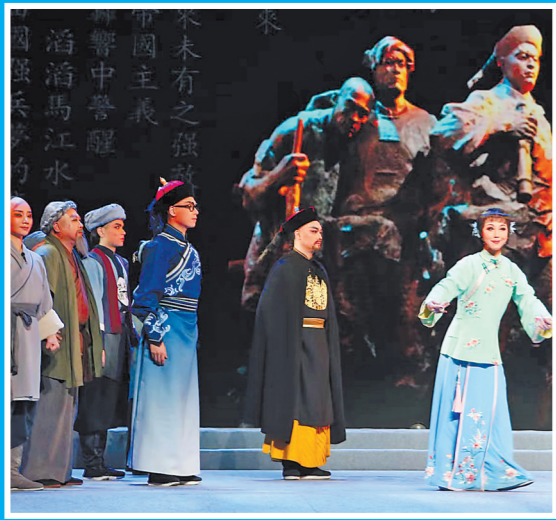
福州市马尾区海峡闽剧团的高甲戏《马江魂》