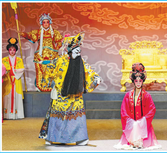
晋江市苑央高甲戏剧团的高甲戏《西施》

15日至25日,第四届全国民营剧团优秀剧目展演在晋江市举行。全国民营剧团优秀剧目展演是中国戏剧家协会于2018年发起的第一个全国性民营戏剧交流展示平台。此次展演,共有来自全国各地的14家优秀民营剧团携经典剧目一展芳华,其中我省3个民间剧团入选。