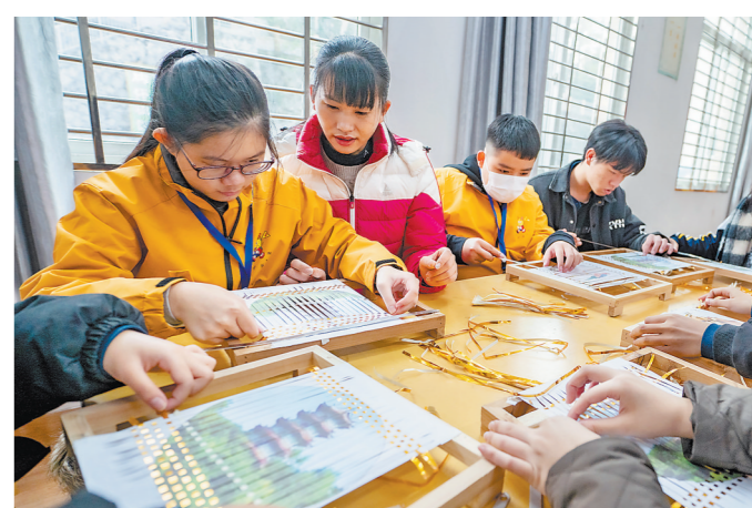
永春县第二中学学生与马来西亚华裔学生一起学习国家级非遗永春纸窗画制作。

永春县是著名侨乡,华侨历史源远流长,现有海外华侨华人110多万,分布世界五大洲51个国家和地区。早在600多年前,永春人从桃源出发,在泉州港“下南洋”,白手起家,打拼事业,创造了一个又一个商业奇迹,成就了“永无不开市”的辉煌。值得一提的是,马来西亚是永春人迁居南洋最早的集中地之一,在马永春侨亲超过80万人,有着“一桌永春人,半个吉隆坡”的佳话,马六甲的鸡场街还建有永春在海外最早的会馆。