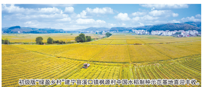
初级版“绿盈乡村”建宁县溪口镇枫源村中国水稻制种示范基地喜迎丰收。

振兴的支柱产业,福建农行深度对接武夷岩茶全产业链各群体需求,聚焦“融资难、融资贵”的痛点难点问题,制定武夷岩茶服务方案,推广“武夷岩茶小微企业贷款”“惠农e贷(武夷岩茶)”等拳头产品,授信金额达20亿元,贷款余额14.5亿元,服务茶农3123户,小微企业105户,助力做优武夷岩茶产业,推动武夷岩茶绿色优势转化为富民优势。