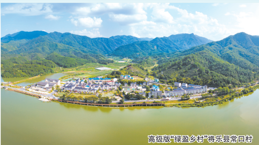
高级版“绿盈乡村”将乐县常口村

共赴绿水青山,助力“双碳”战略,已成为推动经济转型升级、高质量发展的必然要求和动力之源。作为现代经济的血脉,金融在推动绿色发展之路上承担着重要的使命。福建农行全面构建绿色金融服务体系,探索既要“绿水青山”又要“金山银山”的新路径、新机制,让百姓坐拥“生态美”,吃上“生态饭”。截至11月末,福建农行绿色信贷余额782.5亿元,比年初增加290.1亿元,增速达58.9%。