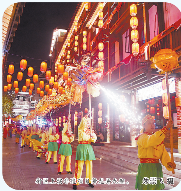
街区上演非遗项目舞龙弄九鲤。