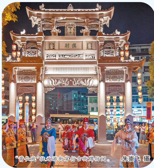
“莆仙戏”表演群舞街市古街牌坊前。