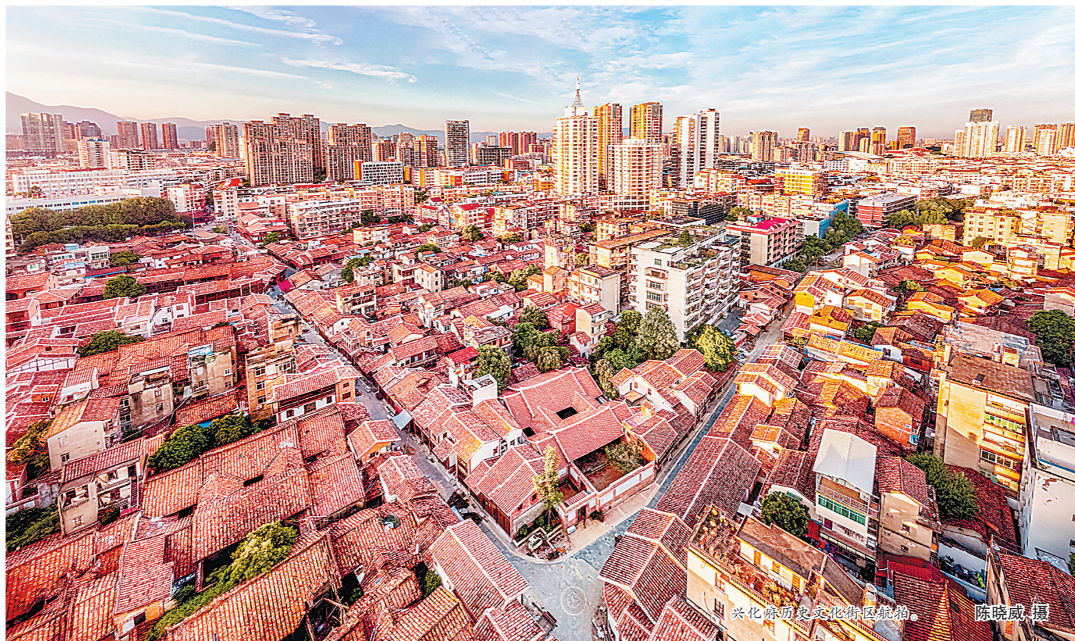
兴化府历史文化街区航拍

2022年5月20日中午，兴化府历史文化街区修缮项目施工现场一片欢腾，根据文献记载，循着世代居民的记忆，大家苦寻了三个月的禄并终于重映天光。