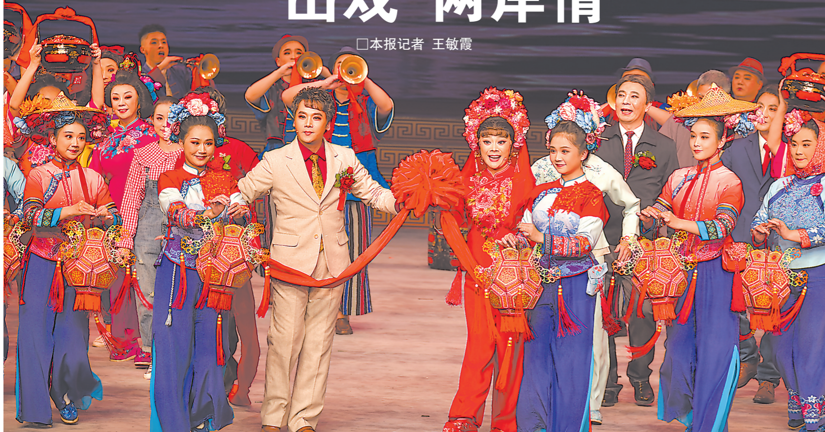
新年戏曲晚会上的“海上婚礼”选段

2023年12月29日,北京国家大剧院,2024年新年戏曲晚会在精彩上演。党和国家领导人同首都各界群众欢聚一堂,一起观看演出,喜迎新年的到来。