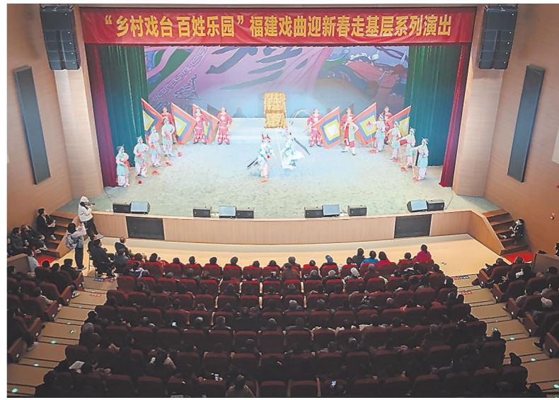
洋下村文化艺术中心的硬件条件不输城市剧场。

“当前,我省许多乡村对戏曲演出的需求十分旺盛,闽剧、高甲戏、歌仔戏(芗剧)、莆仙戏、潮剧等剧种‘两节’期间在农村市场的演出可以用‘火爆’来形容。”省文旅厅相关负责人告诉记者,今年全省地方剧种公益性演出专项经费将继续投入超过1850万元,支持54家地市国有文艺院团以及部分优秀民营院团开展不少于2600场惠民演出。同时,继2023年推动各地试点建设提升200多个乡村戏台之后,今年将再支持建设40多个乡村戏台,因地制宜建设一批接地气、有特色、见实效的乡村戏台,推动乡村优秀传统文化的活化利用和创新发展。