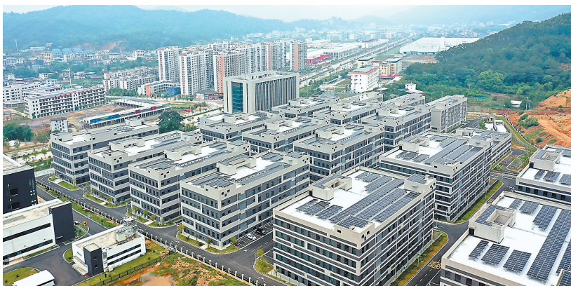
龙岩建设广龙合作产业园,推进与

广州龙岩对口合作重点产业项目集中开工,包括广汽集团等4家世界500强企业项目在內的13个重点产业项目落地龙岩,总投资达138亿元;龙高高铁龙岩至武平段开通暨武平至梅州段(福建段)建设动员会举行,进一步拉近了广龙两地的时空距离……2023年12月26日,龙岩老区双喜临门,广龙两地对口合作重大成果在同一天登场,充分彰显了老区